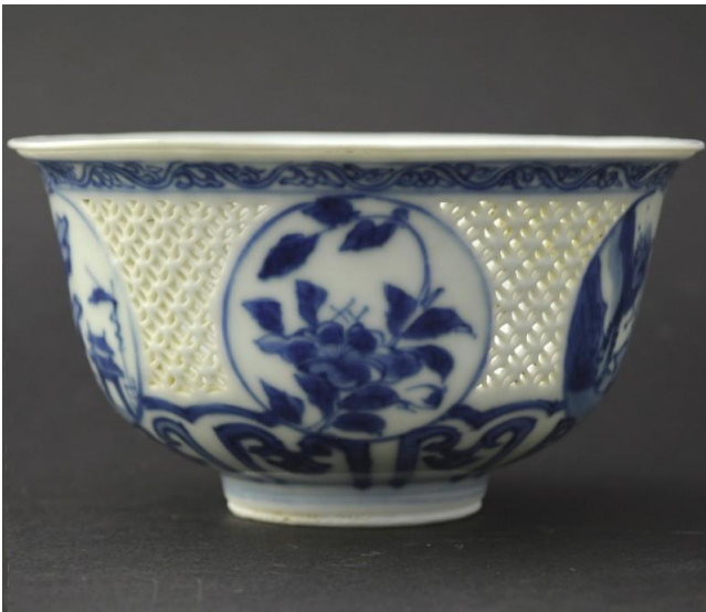
Şekil 3: Mısır Medeniyetine ait ajurlu yüzük (Marston, 2022).

Çin porseleninde duvarlar, bir ağ oluşturmak için açıklıklarla delinir. Çin porseleni üzerinde yapıldığı bu açık esere ling long, "şeytanın işi" veya "has ajur" adı verilmiştir. Ajur sırla doldurulursa, genellikle 'pirinç tanesi' olarak adlandırılır. Mavi beyaz geçişli bir porselen kâse, ajur tekniğinin etkileyici örneklerinden birisidir. Hatcher Cargo, Chongzhen döneminden olan kâse, 9 cm çapında olup kenarları çeşitli manzara ve çiçek motifleriyle süslenmiş dairesel paneller bırakacak şekilde kesilmiştir (Gotheborg, t.y.) (Şekil 3).