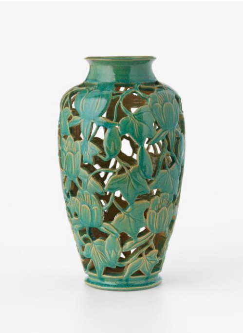
Şekil 5: Klytie Pate, Ajurlu vazo.

Avustralyalı bir sanatçı olan Klytie Pate çalışmalarında formlarındaki kullandığı ajur tekniğiyle ve alışılmadık sır kullanımıyla dikkat çekmiştir. Çanak ve çömleklerinde ajur tekniğini yenilikçi bir anlayışla kullanmasıyla ünlenmiştir. 1930'larda Marguerite Mahood ve Reg Preston gibi sanatçıları olduğu Melbourne sanat çömlekçilerinden birisidir. Kapaklı kavanozlar, kaseler, sürahiler, büyük süslü tabaklar ve duvar karoları yapmıştır. Aerodinamik bir form anlayışını benimsemiştir. Parlak ve canlı renkleri kullanmayı tercih etmiş, geleneksel olmayan malzemeleri sır tariflerinde kullanmıştır. Klytie belirli bir sertliğe gelen formları linocut araçları ile kesmiştir. Teknik açıdan oldukça yetenekli olan sanatçı gündelik eşyalar üzerinde ajur tekniğini kullanarak işlevselliğini yitirmesini sağlamış, heykelsi formlara dönüştürmüştür (Busowsky, 2020: 294) Klytie, ajurlu vazosunda çiçek figürlerine uygun şekilde kesmeyi tercih etmiştir (Şekil 5). Formlar artık sanatsal bir ifadenin ürünü olmuştur. Ajur tekniği, sanatçının ruhani dünyalar yaratmasına yardımcı olmuştur (Busowsky, 2021).