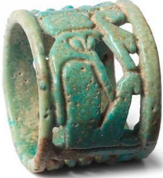
Şekil 2: Mısır Medeniyetine ait ajurlu yüzük (Marston, 2022).

10.yy ve 12.yy.'da Mısır'da sürahi, kap gibi çeşitli seramik kullanım eşyalarının boyun kısmında görülen delikler ajur tekniğinin sadece estetik amaçlı değil aynı zamanda fonksiyonel amaçlı da kullanıldığını kanıtlamaktadır. (Gökçe, 2011:49). Mısırdaki bulunan kaplardaki deliklerin sinek ve böceklerden korunmak için yapıldıkları düşünülmektedir (aktaran Gökçe, 2013:123). Mısır işi yeşil sırlı fayans yüzük M.Ö. 1069-735 civarına ait olduğu düşünülmektedir. 22 mm çapında. 17 mm yüksekliğinde olan yüzükte oturan şahin başlı güneş tanrısı, iki açık lotus çiçeği ajur tekniği ile tasvir edilmiştir (Şekil 2).