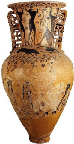
Şekil 1: Proto Attic Amfora, M.Ö.650-657, Ajur Tekniği (Bermudes ve Scott, 2015).

Proto Attic Amfora formunun kulplarında, geometrik üçgenler ve dikdörtgenler içeren delikler bulunmaktadır. Bu deliklerin dekoratif amaçlı uygulandığı düşünülmektedir (Bermudes ve Scott, 2015) (Şekil 1).