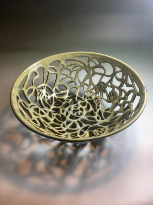
Şekil 6: Kiya Nicole, Kap Serisi.

Kiya Nicole Filedelfiyalı bir seramik heykel sanatçısıdır. Sezgisel olarak yaratmaya çalıştığı eserlerinde ajur tekniğini kullanmaktadır. Dokunma deneyiminin rehberlik etmesine izin vererek formlarını yaratmaya çalışmaktadır. Duyum ve hafıza üzerine bir meditasyona dönüştürmek istediğinden bahsetmektedir. Bedenin ve kişisel gelişimin doğasını araştıran sanatçı, değişim yaratmak için kendi içindeki kaynağı kullanır (Nicole, 2022). Formlarını kesmeye başladığında genellikle bir planı olmadığından bahseder. Çalışma esnasında kilin kendisiyle olan iletişimine izin verdiğini ve tornada çekilen bir form ile başladığını belirtir. Kesme işlemi başladığında artık geri dönüşü olmadığından tek seferde çalışmayı bitirmek ister. Kesme işlemi yaptıktan sonra yüzeyi inceltmenin ve pürüzleştirmenin ardından çalışmaları fırınlanır. Genelde raku ve odun fırınına tercih eder. Form yaratım sürecinde ajur tekniğini dekoratif amaçlı kullanmamaktadır. Ajur tekniğinden formun strüktürünü oluştururken yararlanmaktadır (Şekil 6).