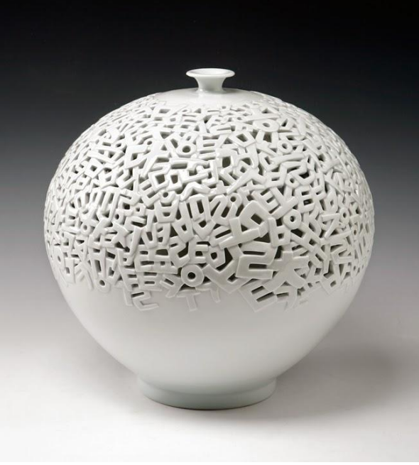
Şekil 4: Seong Keun, Poetica.

Kaynak: Park, A. J. (2015). Jeon Seong Keun: Poetic Space and Form. Erişim tarihi: Aralık 5, 2021, http://jeonseongkeun.blogspot.com/2015/02/jeon-seong-keun-poetic-space-and-form.html