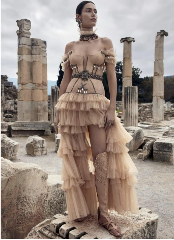
Görsel 4: Apasas 2021 Yaz Couture koleksiyonundan bir fotoğraf

Karacalar'dan (2010: 69) edinilen bilgiye göre New York Metropolitan Müzesinde bulunan Antik vazolar üzerindeki mücadele sahnelerinde Amazon kadınının boyundan bağlamalı ve omzuna dökülen desenli bir pelerin giydiği görülmektedir. Böylece Amazon uygarlığına ait kıyafetler ile Apasas koleksiyonundaki Görsel 3'deki bu giysi arasında yakın bir benzerlik görülmektedir. Ayrıca pelerinin üzerindeki kültürel motifler Kastamonu ve Bartın yörelerine ait tel kırma-sarma ve saçak bağlama teknikleri ile gerçekleştirilmiştir. Bu el sanatlarının uygulandığı bölge Amazon uygarlığının yerleşim yeri olan Karadeniz bölgesini ele almaktadır. Giysi üzerinde kullanılan işleme teknikleri ile Anadolu'da yaşayan Amazon uygarlığı arasında yakından bir ilişki kurulduğuna söylemek mümkündür.