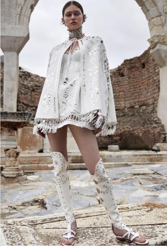
Görsel 3: Apasas 2021 Yaz Couture koleksiyonundan bir fotoğraf