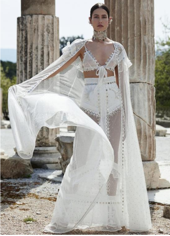
Görsel 7: Apasas 2021 Yaz Couture koleksiyonundan bir fotoğraf