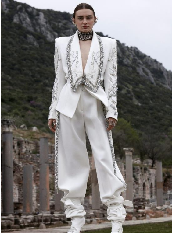
Görsel 5: Apasas 2021 Yaz Couture koleksiyonundan bir fotoğraf

Bu bağlamda Apasas koleksiyonundaki giyside kullanılan omuz, yırtmaç ve aksesuarlar Amazon kadınının kıyafetindeki detaylar ile benzerlik kurmaktadır. Ayrıca Elbisenin yaka kısmında kullanılan detayda ise Rönesans dönemi etkilerini de görmek mümkündür. Rönesans döneminde kullanılan Ruff yaka statünün simgesi olarak kullanılırken günümüzde tasarımcının modern yorumuyla dikkat çekicilik ve ihtişamın göstergesi olarak da kabul edilebilir.