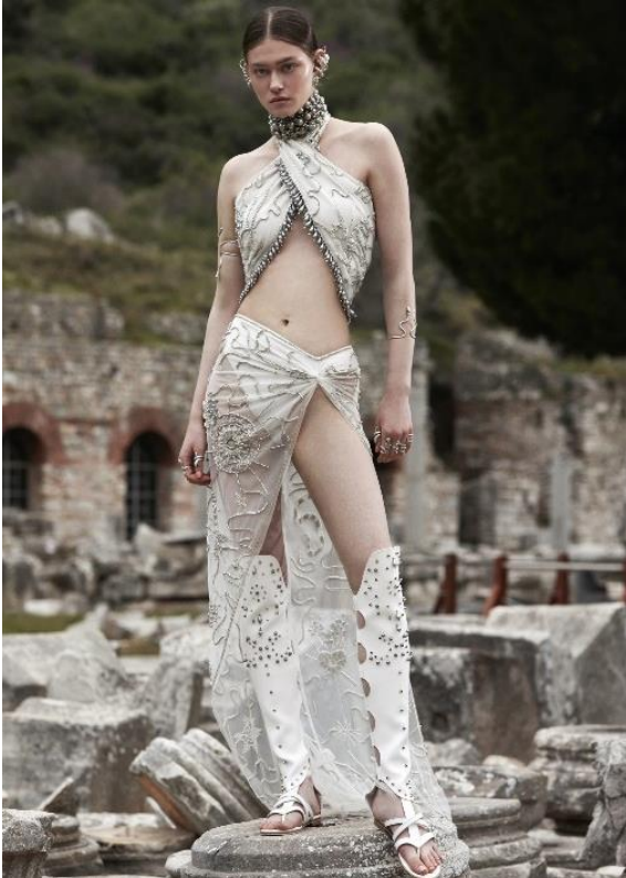
Görsel 2: Apasas 2021 Yaz Couture koleksiyonundan bir fotoğraf