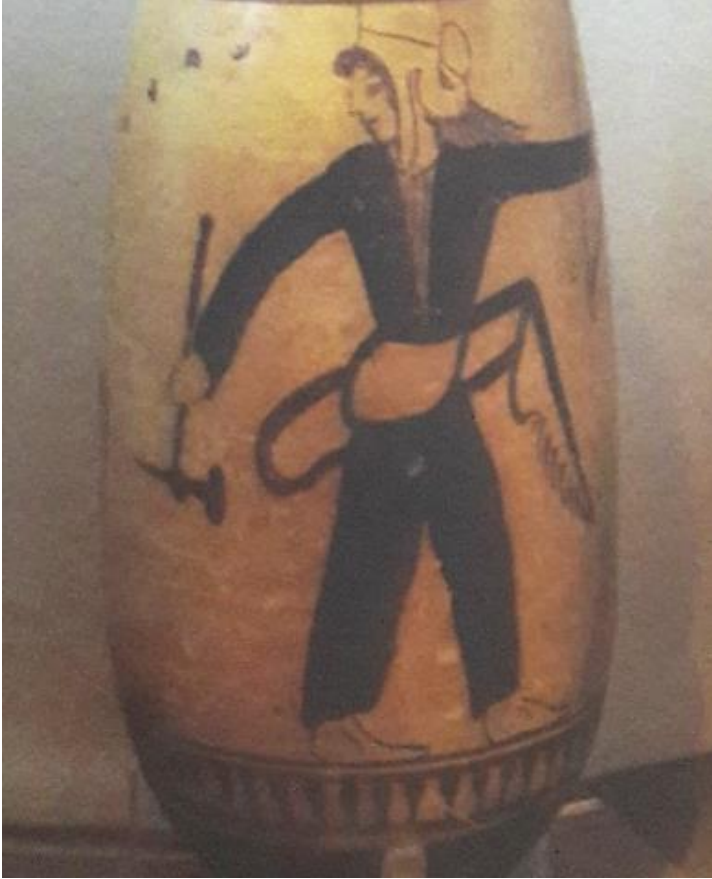
Görsel 6: Antik vazo üzerine tasvir edilmiş İskit savaşçısı

Sicilyalı Diodorus Amazonların İskit topluluğunun bir kolu olduğundan bahsetmektedir. İskit savaşçılarının giysileri incelendiğinde Durmuş (2008: 70) vücudu saran ceket ve pantolon ayrıca bileği bağcıklarla saran çizme giydiklerini ve birkaç çift küpe, yüzük ve bilezik kullandıklarını belirtmektedir. Ayrıca Berlin Arkeoloji müzesinde Amazon-İskit sergisinde bulunan bir vazo üzerinde yer alan İskit savaşçısı figürünün pantolon-ceklet takım giydiği görülmektedir.