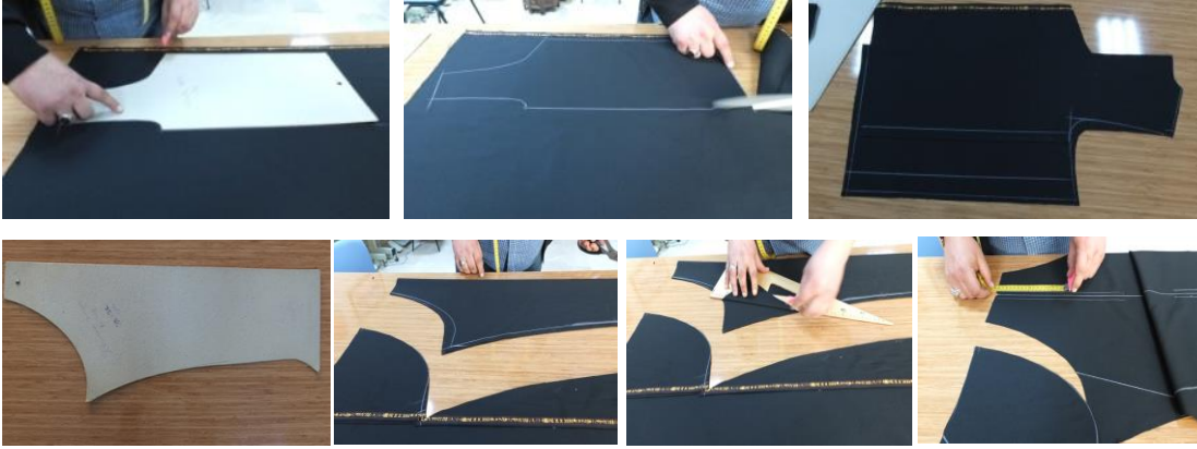
Görsel 10: Kalıbın kumaşa yerleştirilmesi ve kesilmesi ve ön bedene kup çizimi