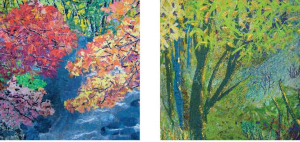
Şekil 9-Noriko Endo Konfeti Tekniği Çalışmaları (Sider, s. 135)

daha fazla yer vermeye başlamıştır. Empresyonist tasarımlarında ağaç manzaranın yanında balıkçılar, sincaplar, kaplumbağalar gibi hayvan desenlerine ve ağaçların, canlıların suya yansımalarına da yer vermektedir(Brubaker Knapp, 2010).