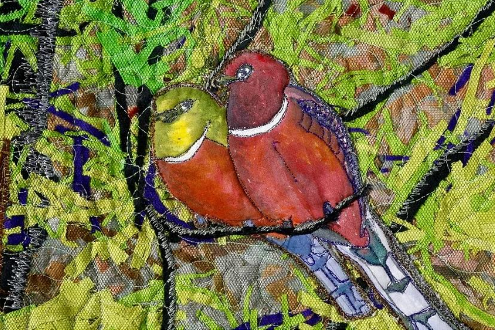
Şekil 18-Guest Appearance Yakın Plan Görünüm