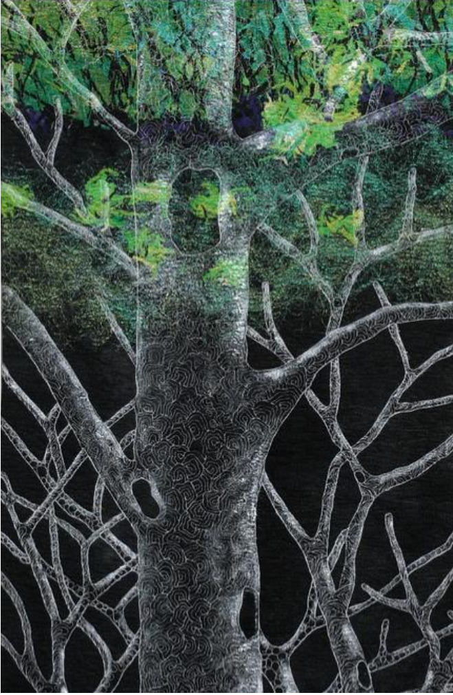
Şekil 16-Alive In The Shadow-2

167x220cm ebatlarında çalışan Chery Blossom-3 isimli eser Pamuk, polyester, ipek ve tül ana malzeme olarak kullanılmıştır. Aplike, kapinote ve nakış tekniği uygulanmıştır (Seilman, 2008). Tekstil sanatçısı Noriko Endo, Japonya'nın simgesi olan kiraz çiçeklerini izlenimci panolarına yansıtmıştır. Sanatçının özdeşleştiği kiraz çiçekleri eserlerinde sıklıkla yer verdiği öğelerdir. Chery Blossom-3 çalışmasında da kiraz çiçekleri kumaşlardan tek tek kesilerek form verilmiş ve akrilik boya ile renklendirilmiştir.