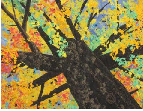
Şekil 4-Konfeti Tekniği Pano