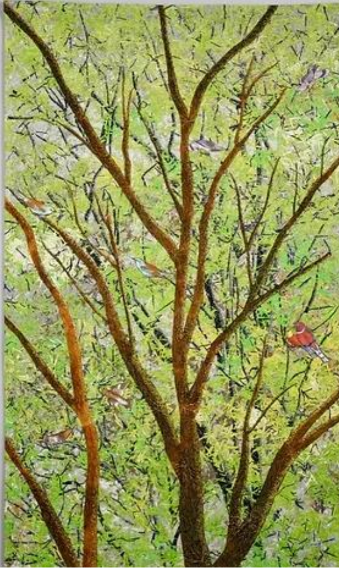
Şekil 19-Guest Appearance