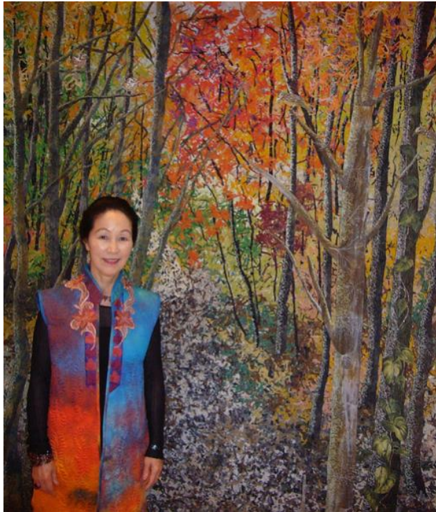
Şekil 8-Japon Tekstil Sanatçısı Noriko Endo