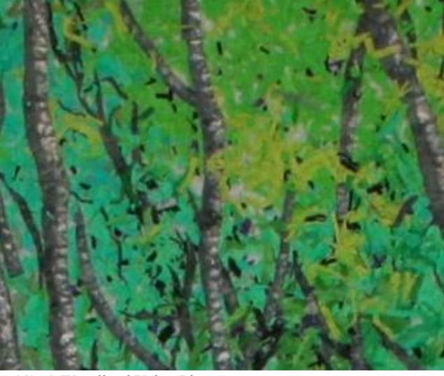
Şekil 13-Woodland Yakın Plan Görünüm