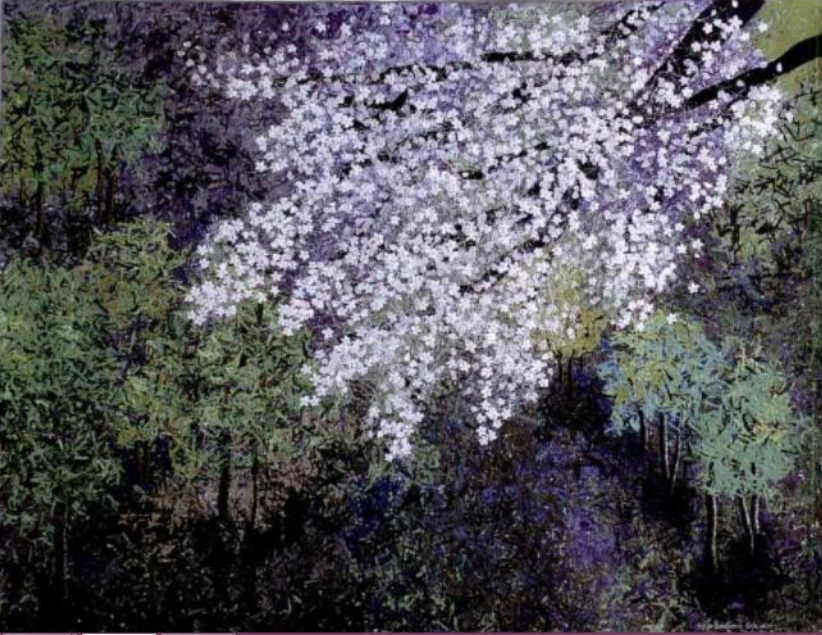
Şekil 14-Chery Blossom-3

172x175 cm ebatlarında çalışılan Earth Stories Woodland isimli çalışma 2013 yılında yapılmıştır. El boyaması pamuklu kumaş ve akrilik boyalarla renklendirilmiştir. Şekil-12 konfeti kumaş parçaları ve ağaç gövdelerinin akrilik boya ile renklendirildiği görülmektedir.