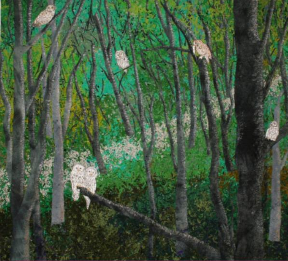
Şekil 12-Earth Stories Woodland

2004 yılında “Silent Sentinels” ismi ile çalışılan konfeti battaniye 170x190 cm ebatlarındadır. Konfeti parçaları pamuk ve polyester kumaştan çalışılmıştır. Tülle kaplanmış tekstil yüzeyi serbest kapitone dikişleri ile sabitlenmiştir. Aplike çalışmaları görsel detayları oluşturmuştur (Seilman, 2008).