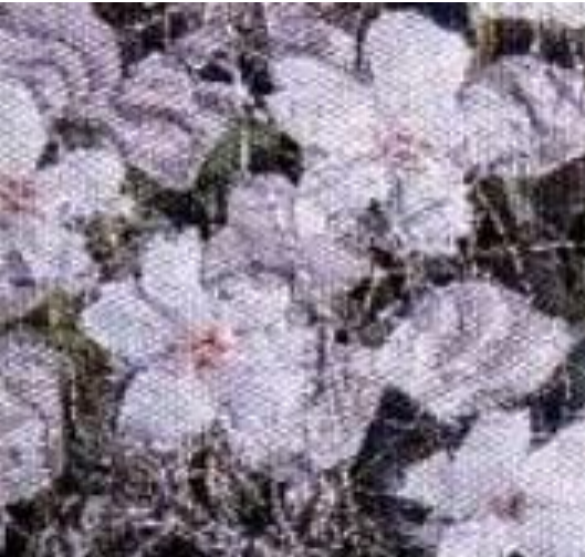
Şekil 15-Kiraz Çiçekleri