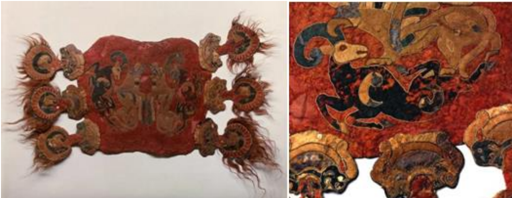
Şekil 1-Pazırık Kurganı Örtü

M.Ö. 5. yy’a ait Sibiryâ’da bulunan Türk sanatının ilk örtü örneği Pazırık Kurganında yer almaktadır. Renkli keçe parçalarından yapılmış bu buluntu yatak örtüsü tarzında kullanıldığı sanılmaktadır. Örtü üzerinde hayvan mücadelesinin sahnelendiği, konturlarının soyut spiral çizgilerle iğneardi işleme tekniği ile işlendiği ve tersinden kaba bir dikişle teyellenmiş olduğu, önemli parçalardan biri olarak gösterilmektedir (İmer, s. 3).