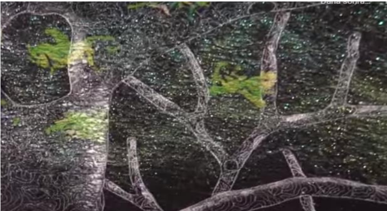
Şekil 17-Alive In The Shadow-2 Yakın Görünüm

Alive In The Shadow-2, 2014 yılında 67x150cm ebatlarında çalışılmıştır. Koyu zemin üzerine simli şeffaf ipliklerle kapitone çalışması yapılmıştır. Simli akrilik boy ile renklendirilmiştir. Şekil-16 çalışmanın tamamı görülmektedir. Şekil-17'de akrilik boya ile renklendirme çalışması yakından görülmektedir. Şeffaf ipliklerle ağaç deseni nakış olarak işlenmiştir.