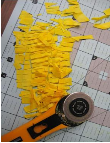
Şekil 5-Kumaş Konfeti Parçaları