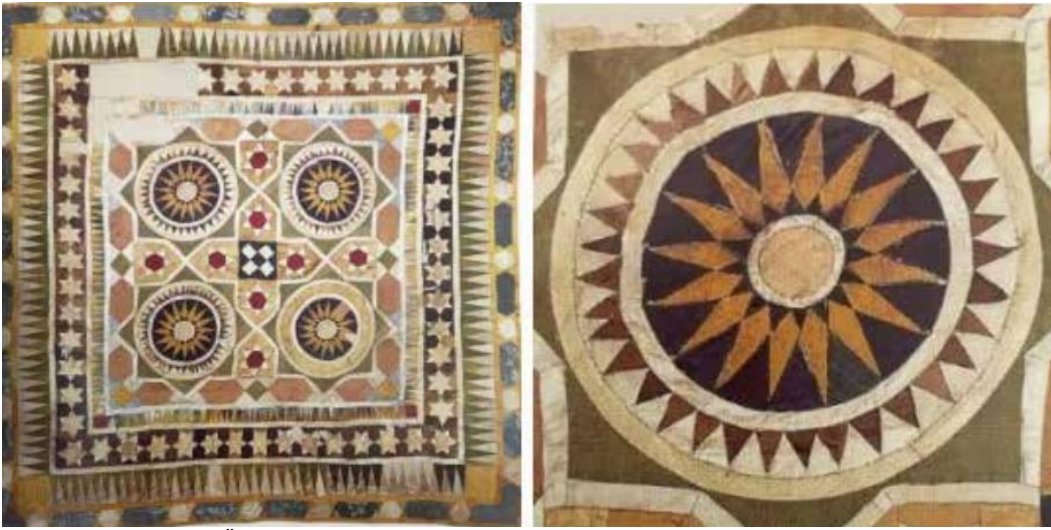
Şekil 2-Yamalı Bohça Örnekleri 16.yy

Osmanlı döneminde Bosna'nın Banyaluka yöresinde benaluka, banaluka veya manyaluka ismi ile anılmaktadır. 17. - 18. ve 19. yüzyıllarda çok güzel seccadeler, minder örtüleri, bohçalar, perdeler ve duvar halıları yapılmıştır. Benaluka tekniği, küçük ve renkli kumaş parçalarının geometrik olarak kesilerek, yan yana dikilip, birleştirilmesiyle uygulanmaktadır(Olguner Ergene, 2011, s. 60-72).