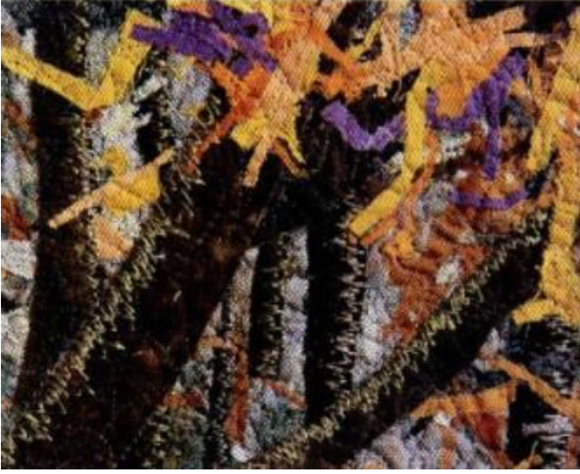
Şekil 7- Noriko Endo- Sonbahar Panosu- Yakın Plan Görünüm (Seilman, 2008)

Şekil-6'de Noriko Endo'nun 2015 yılında yapmış olduğu Sonbahar isimli çalışması bütün olarak görülmektedir. Konfeti parçaları eserde birer fırça darbesi olarak görev almıştır. Şekil-7'de konfeti kumaş parçaları yakın plandan görülmektedir. Çalışma üzerinde yapılan serbest kapinote dikişleri tüm tekstil yüzeyinde uygulanmıştır.