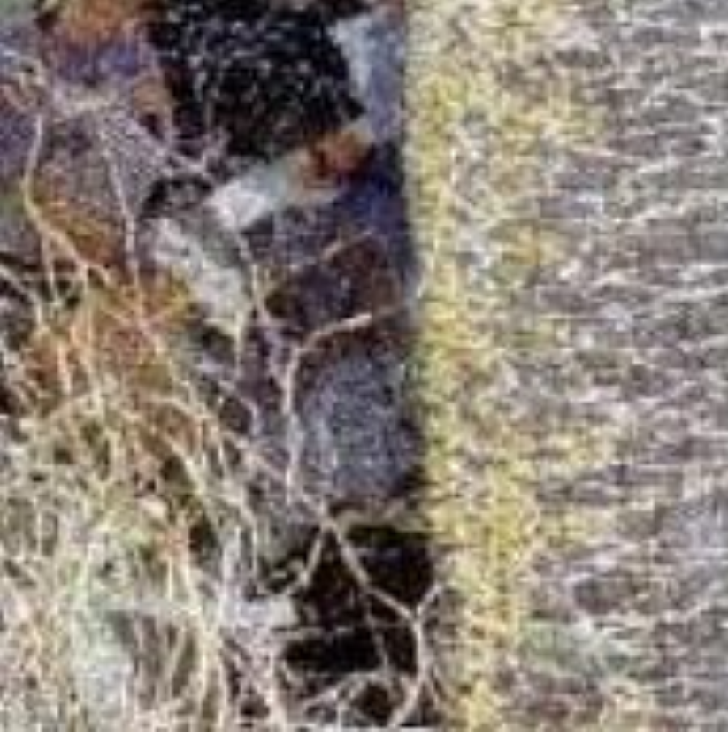
Şekil 11-Silent Sentinels Yakın Plan Görünüm

2004 yılında “Silent Sentinels” ismi ile çalışılan konfeti battaniye 170x190 cm ebatlarındadır. Konfeti parçaları pamuk ve polyester kumaştan çalışılmıştır. Tülle kaplanmış tekstil yüzeyi serbest kapitone dikişleri ile sabitlenmiştir. Aplike çalışmaları görsel detayları oluşturmuştur (Seilman, 2008).