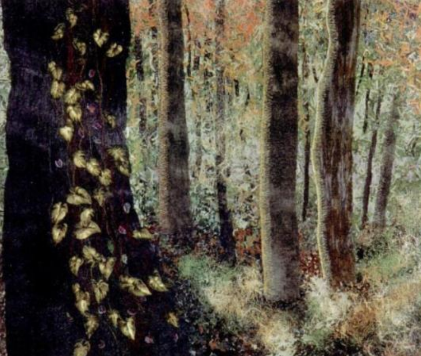
Şekil 10-Silent Sentinels