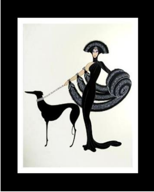
Görsel 7. 1982, Siyahlı Senfoni

Erte 1990 yılında New York Radio City Music Hall'da sahne alan Easter Show için kostüm ve dekor tasarlamıştır. 21 Nisan 1990 yılında Paris'te hayatını kaybeden Erte'nin 50 yeni heykel ve serigrafi eserinin yer aldığı "Erte, The Last Works" (Erte, Son Çalışmalar) isimli kitap aynı yıl piyasaya sürülmüştür. Ayrıca kitapta tasarımcının tüm grafik çalışmaları ve bronz heykellerinin olduğu 176 adet renkli illüstrasyonda kullanılmıştır.