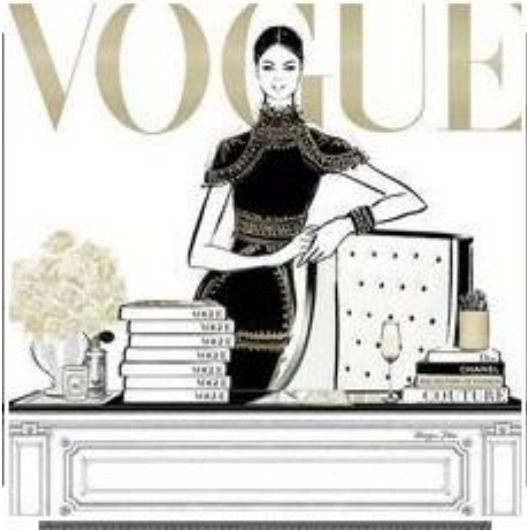
Görsel 9. “Vogue” Dergi Kapağı

Aynı yıllarda Louis Vuitton spor ayakkabı serisi için bir animasyon tasarlamıştır (Görsel 10.). 2017'de Dior'un Londra'daki moda defilesinin canlı eskizini yapmak için davet edilmesi onun büyük moda evleriyle işbirliği yapmasına imkân sunmuştur.