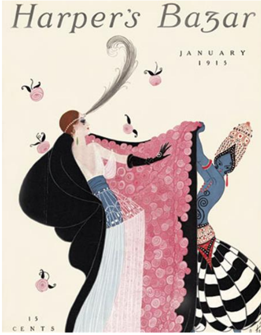
Görsel 1. 1913, "Harper's Bazar" Dergi Kapağı

Erte'nin dergi kapağı tasarlarken tek sınırlaması, koleksiyonlar için dört farklı kapak sunması gerekliliği olmuştur. Bir ilkbahar kapağı, bir sonbahar kapağı, kürk ve kozmetik üzerine ayrı kapak hazırlaması gerekmiştir (Fogg, 2014: 213). Harper's Bazaar dergisi için 240'ın üzerinde kapak tasarlamış olan Erte'nin; Illustrated London News, Cosmopolitan, Ladies' Home Journal ve Vogue dergileri için de ayrıca çizdiği çok sayıda illüstrasyon mevcuttur.