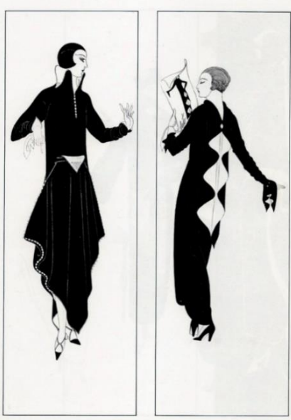
Görsel 3. 1924, Erte tasarımları.

kumaş baskı düğmeler ve bantlı ayakkabı tasarımı ile Erte, moda dünyasında; moda illüstratörü ve tasarımcı olarak çıkış yakalamıştır (Görsel 3.) (Dereboy,2008: 23). Erte aynı zamanda Broadway’de ünlü Fransız şarkıcı Irene Bordoni için giysi tasarlamıştır. New York’taki yaşamı sırasında sinema için, M-G-M firmasına film kostümleri tasarlamıştır. New York’taki Radio City Müzik Salonu’nda, müzikal ve tiyatro prodüksiyonlarında ve yine aynı kentte bulunan George White’ın ünlü Skandallar Kulübü’ndeki kabare gösterilerinde fırtınasını estiren Erte’nin tasarımlarından birisi de Metropolitan Museum tarafından satın alınmıştır (Zengingönül, 1994: 93).