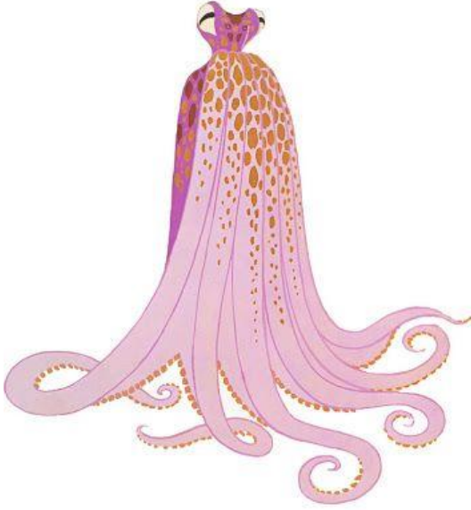
Görsel 5. 1946, Ahtapot (Octopus) kostümü.

New York'ta gösterilen The Botton of the Sea için tasarladığı meşhur pembe ahtapot kostümü ile dikkatleri üzerinde toplamıştır (Görsel 5).