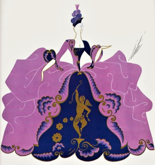
Görsel 4. 1930, Casanova at the Scala kostüm örneği

Erte’nin en özenli tasarımlarından birisi de 1930’daki Berlin’deki Casanova at the Scala gösterisi için yaptığı çalışmadır. Çünkü bu sayede Erte’nin tasarımları özellikle müzik okulları ve müzikal gösterilerdeki kostüm tasarımcılığında büyük bir ilerlemeye önderlik etmiştir. Aynı zamanda bu çalışması Erte’nin kumaş konusunda en cömert olduğu çalışma olarak bilinmektedir (Görsel 4.).