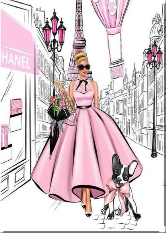
Görsel 11. Megan Hess x Chanel

İllüstrasyon çalışmaları için; özel bir Montblanc kalem ve mürekkebi ile elle çizdiğini belirten Hess, ardından çalışmalarını ya siyah beyaz bıraktığını ya da guaj, suluboya ve dijital ile renklendirdiğini açıklamıştır. Ayrıca özel müşterileri için yapacağı tasarımları için de önce hayal kurduğunu ve çizeceğim şey hakkında ilham almak için iyi bir başlangıç zamanına ihtiyacı olduğunu bildirmiştir (Maguire, 2021).