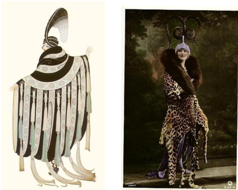
Görsel 2. Sağdaki Gaby Deslys'nin giydiği kostüm. Soldaki: Gaby Deslys için Erte'nin tasarladığı kostüm.

Erte'nin Amerika'daki önemli başarılarından ilki, 1920'de ölen Fransız dansçı Gaby Deslys için kürk detaylı ve abartılı şapka formundaki giysi tasarımı olmuştur (Görsel 2.).