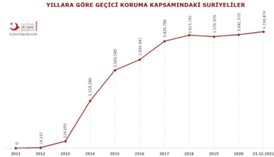
Şekil 2: Türkiye'deki Geçici Koruma Altındaki Suriyelilerin 2011-2021 Arasındaki Sayısal Değişimi