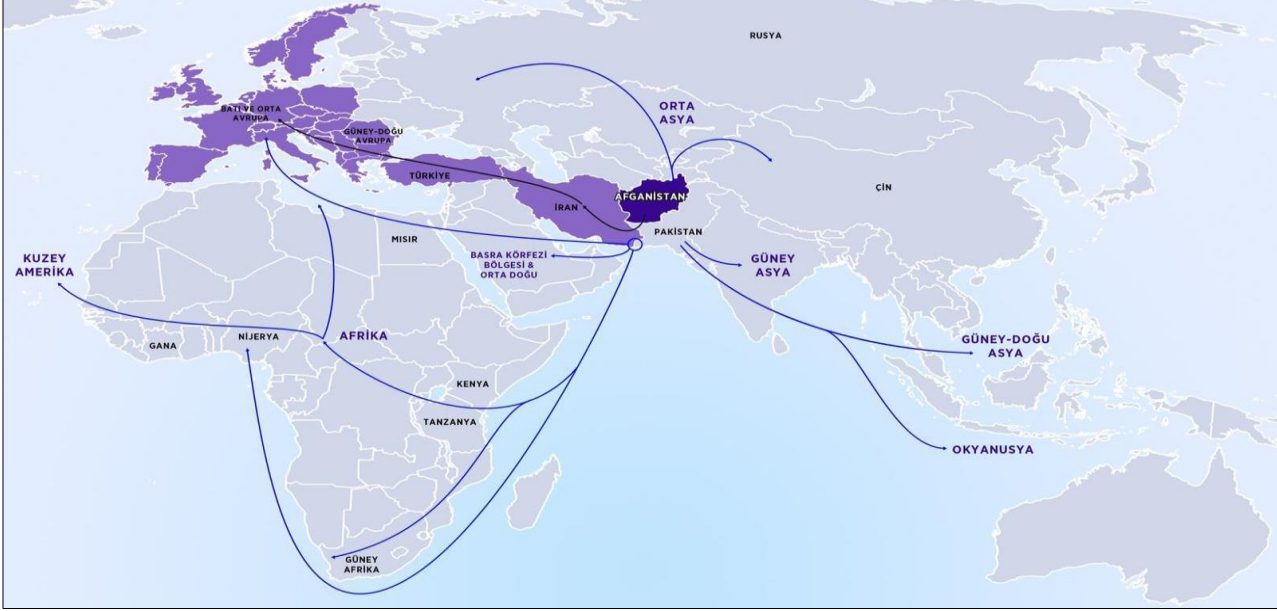
Şekil 2: Balkan Rotası'nın bir görüntüsü. (TUBİM, 2020: 37)

Yıllar öncesi dönemlerde afyon üretimi ve eroin kaçakçılığıyla olumsuz bir biçimde ilişkilendirilen Türkiye'den bugünün uluslararası saygın raporlarında Afganistan'da üretilerek Batı'ya kaçırılan eroinin önlenmesinde "merkezi öneme sahip" bir ülke olarak bahsedilmesi anlamlıdır.