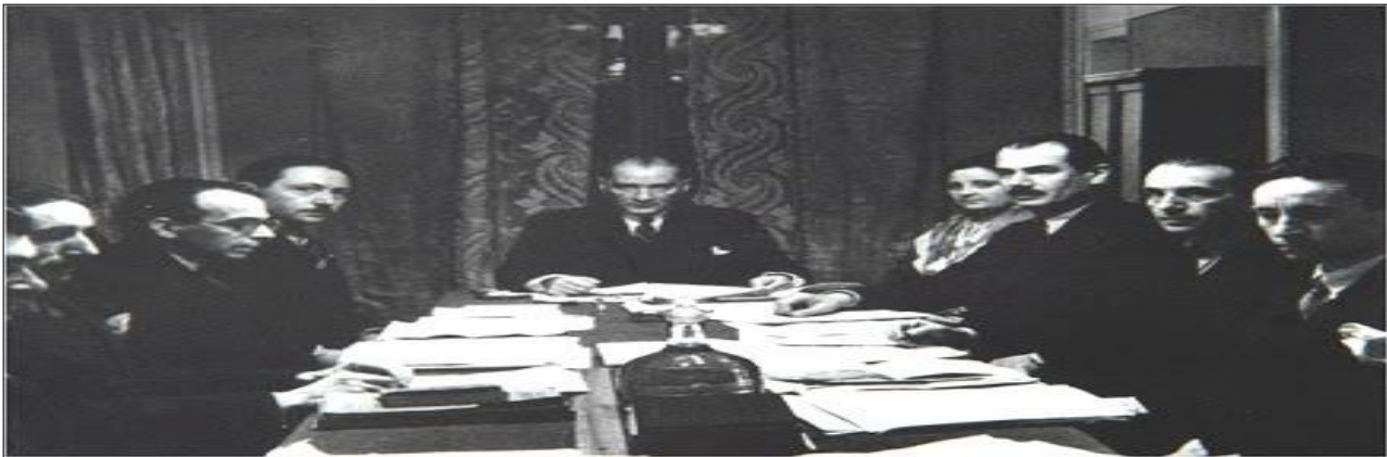
Şekil 1: Gazi Mustafa Kemal Atatürk'ün bir görüntüsü. ( http://www.dildernegi.org.tr/TR,461/ataturkun-turk-dil-kurumu.html )

25 Aralık 1932 tarihinde Gazi'nin "Bütün bu güç koşullar altında bile Türkiye Cumhuriyeti Hükümeti geçmişin doğal afetlerinden daha korkunç olan uyuşturucu maddelerden insanlığı kurtarmak çabasını sürdürecektir, bundan büyük sevinç ve mutluluk duyacaktır." vecizesi yönünde bir araya gelen Bakanlar Kurulu Toplantısı'nda Türkiye'nin 1912 La Haye, 1925 ve 1931 Cenevre Sözleşmeleri'nin temel ilkelerini benimsemesine karar verilmiştir (İnönü Vakfı, t.y.).