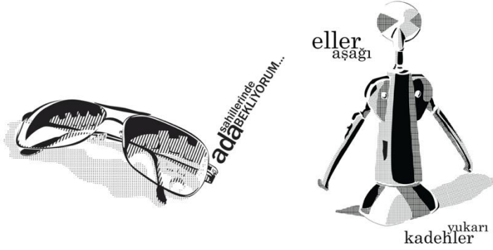
Görsel 1-2: ‘Tireleme’ Başlıklı Proje için Öğrenci Çalışmaları

göstermektedir. 2012-2013 Eğitim Öğretim Yılında üretilen çalışmalarda nesnelerin hacimsel görünüşleri ışık ve gölge gibi unsurlara dikkat edilerek oluşturulmaya başlanmıştır. Öncelikle objelerin karakalem tekniği ile gerçekçi etüdü yapılmış, ardından bu etüdüdeki koyu, açık ve ara tonlar (sadece tek bir ton olarak) guaj boya ile biçimlendirilmiştir. Son olarak guaj boya ile ortaya çıkan görünüş bilgisayarda vektörel çizim programları ile sadece siyah renkten oluşacak bir anlatıma çevrilmiştir. Örneklerde de görüldüğü üzere çizgi elemanın farklı kalınlık ve farklı boşluklara sahip olması farklı ara ton (gri) etkilerini üretmektedir.