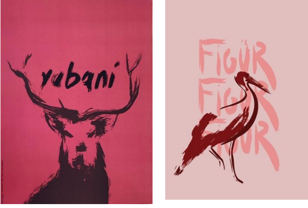
Görsel 15-16-17: ‘Hayvanlar’ Başlıklı Proje için Öğrenci Çalışmaları

Grafik resim çalışmalarında tipografik unsurlar da çoğu zaman kompozisyonun resimlemeler ile bir bütün oluşturacak parçası olarak yer alır. Hiçbir zaman resimlemeler ile tipografik unsurlar bu kompozisyonlarda bağımsız olarak düşünülmezler. Tipografik unsurlar işlevsel yönlerini korumak kaydıyla kimi zaman resimlemenin bir parçası gibi görünürken kimi zaman ise resimlemeden farklı bir anlatım diline sahip olsalar da kompozisyon dengesini öne çıkartacak şekilde resimlemeleri tamamlarlar. Görsel 18. ve 19.’da da görüldüğü üzere, 2019-2020 Eğitim Öğretim Yılında gerçekleştirilen ‘İnsan-Tipografi’ başlıklı proje örnekleri aynı bir önceki proje örneğinde olduğu gibi resimlemenin bir parçası gibi kompozisyon içinde yer almaktadır. Bu projede rastgelen seçilen figür görsellerinin grafik bir anlatım diline dönüştürülerek belirli bir anlam bütünlüğü oluşturmak kaydıyla yazılacak tipografi ile kompoze edilmesi beklenmiştir. Diğer bir deyiş ile tipografik başlıklar ve resimlemeler aynı zamanda anlamsal olarak birbirini eksik olan anlatımları karşılayarak tamamlamaktadır. Başlıklardaki anlam resimlemeler yoluyla açıklanmaktadır. Diğer taraftan diğer projelerde olduğu gibi bu projede de kompozisyon için öncesinde seçilen formattaki tüm görsel unsurlar bir istif şeklinde kurgulanırken, bu istif var edecek olan boş alanlar da (beyaz alan- negatif alan) bilinçli olarak belirlenmektedir.