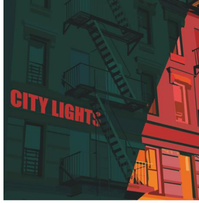
Görsel 34-35: 'Şehir Işıkları' Başlıklı Proje için Öğrenci Çalışmaları