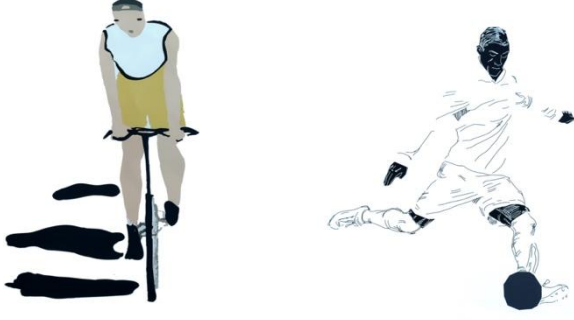
Görsel 11-12: ‘Spor’ Başlıklı Proje için Öğrenci Çalışmaları