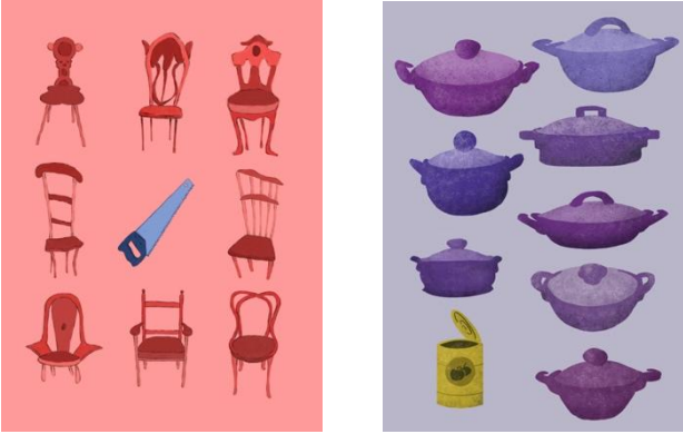
Görsel 7-8: 'Karşıt Nesnelere' Başlıklı Proje için Öğrenci Çalışmaları

Araştırma kapsamında incelenen ve objelere ait grafik anlatımların geliştirildiği projelerdeki son örnek 2020-2021 Eğitim Öğretim Yılında gerçekleştirilen Detay' başlıklı projedir. Bu projede öğrencilerden aynı objenin farklı açılardan belirlenecek olan görünümünü bir dil birliği oluşturacak şekilde ifade etmeleri istenmiştir. Öğrenciler bu dil birliğini; nesnelere grafik biçimlerine dikkat ederek renk, üretim tekniği veya benzeri bir yaklaşımla sağlama çabasına girmişlerdir. Projede üretilen çalışmalar son olarak A4 formatındaki bir yüzeye tek bir kompozisyonun parçaları olacak şekilde yerleştirilmişlerdir. Bu şekilde bir taraftan tek bir nesnenin fiziki özellikleri, her bir detayın kendi içinde çözülmesi gereken form yapısı ile birlikte ayrı ayrı çalışılmış, bir taraftan da tüm çalışmalar aynı kompozisyonda birbirini destekleyen görünüme, yüzey değerlendirmesine ulaştırılmışlardır (Görsel 9.-10.).