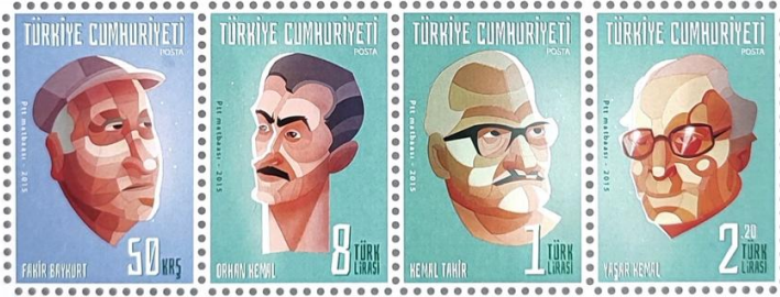
Görsel 24: ‘Ünlüler’ Başlıklı Proje için Seri Şekilde Öğrenci Çalışması

Örneklerde de görüldüğü üzere kimlikleri var eden spesifik özellikler leke ağırlıklı kullanımlarla, pul tasarımının gereklilikleri olan diğer unsurlara (format ve tipografi gibi) birleştirilmiştir. Her bir öğrenci bu projede 4’lü bir seri olacak şekillendireceği ve buna göre belirleyeceği içeriklere aynı grafik anlatım dilini yansıtmayı amaçlamıştır (Görsel 24.).