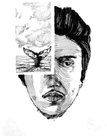
Görsel 29: ‘Tireleme-Kolaj’ Başlıklı Proje için Öğrenci Çalışması ve Detay