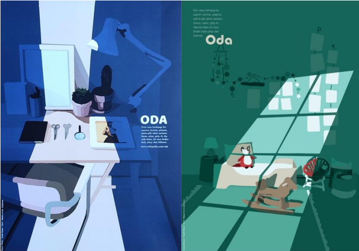
Görsel 32-33: ‘Oda-Işık’ Başlıklı Proje için Öğrenci Çalışmaları

Mekan sınıflandırması ile ilgili bir diğer örnek proje 2016-2017 Eğitim Öğretim Yılında yürütülen ‘Oda-Işık’ başlıklı projedir. Bu projede her bir öğrencilerden iç mekan çalışmasını deneyimlemek üzere evin farklı odalarından birisini seçmesi istenmiştir. Bu projede de farklı bakış açılarıyla çekilmiş olan fotoğraflardan yapılacak kadraj belirleme işlemi sonrası bilgisayarda vektörel çizim işlemine geçilmiştir. Projeyi diğer örnek projelerden ayıran en önemli fark renk unsurunun içeriği belirleyecek derecede aktif olarak kullanılmış olmasıdır. Görsel 32. ve 33.’de de görüldüğü üzere kompozisyonlarda kaynağı pencere olan bir noktadan vuran keskin bir ışığın kullanımı eklenmiştir. Böylece kompozisyonlardaki ışıklı ve ışıksız alan içindeki resimlemelerin renk birlikteleri farklı bir mantıkla işlenebilmiştir. Çalışmalarda başlık ve kısa bir metin şeklinde belirlenen tipografik unsurlar kompozisyonun bir parçası olarak düşünülüp, istife, negatif alana ya da vurgu yapılacak öğeye göre konumlandırılmıştır.