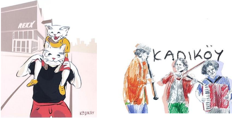
Görsel 13-14: ‘Kadıköy’ Başlıklı Proje için Öğrenci Çalışmaları

2014-2015 Eğitim Öğretim Yılında gerçekleştirilen ‘Kadıköy’ başlıklı projede ise aynı temel ifade unsurları Kadıköy İlçesinin imgesel yapısını bilindik olmayan, ancak yine ilçenin spesifik karakteriyle eşleşen bir yapıda üretilmesine imkan tanımıştır. Bir kartpostal projesi olarak da çalışılan resimlemelerde fikirsel içerik öne çıkartılarak, bilinen ancak ilk akla gelmeyen anlatımlara, iletilere yer verilmeye çalışılmıştır. Bunu yaparken figür kullanımını öne çıkartmak kaydıyla, diğer bir deyiş ile figür sınırlaması ile birlikte grafik anlatım dilini sınırlamaları kartpostal formatındaki yüzey üzerinde değerlendirilmiştir (Görsel 13. ve 14.)