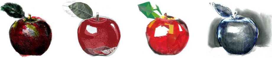
Görsel 3-4-5-6: ‘Elma’ Başlıklı Proje için Öğrenci Çalışmaları

2014-2015 Eğitim Öğretim Yılında ‘Elma’ başlıklı projede her öğrenciye aynı elma görüntüsü verilmiş ve bu aynı görüntüden farklı grafik anlatımların ortaya çıkartılması beklenmiştir. Grafik bir anlatımı ortaya çıkartan en önemli unsurlardan birisi de pek tabii uygulama tekniğidir. Her bir tekniğin kendi olanakları ve kendine has dokusal görünüşleri vardır. Görsel 3., 4., 5. ve 6.’da tekniğin elverdiği bu sınırlama ile birlikte resimleyen de seçeceği özgün ifade biçimi aynı görüntüden farklı yorumlara ulaşabileceği olmanın örnekleri gösterilmektedir. Bu projede her bir öğrenciye ayrı ayrı olmak üzere önceden berlenmiş olan iki veya üç farklı tekniğin bir arada kullanımı ile bir üretim yapmaları istenmiştir. Öğrenciler üretimlerini yaparken elmanın görüntüsü ve fiziki yapısını irdeleyerek gerçekçi bir etüdüden çok yeni ama yine bir elma çağrışımı yapan grafik bir anlatıma ulaşmaya çalışmışlardır.