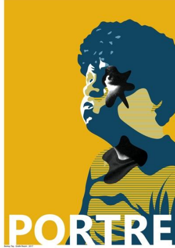
Görsel 27-28: ‘Leke-Çizgi-Portre’ Başlıklı Proje için Öğrenci Çalışmaları