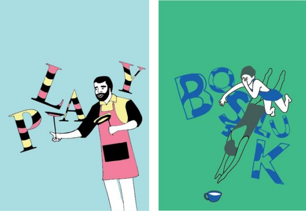
Görsel 18-19: ‘İnsan-Tipografi’ Başlıklı Proje için Öğrenci Çalışmaları

Grafik resim çalışmalarında tipografik unsurlar da çoğu zaman kompozisyonun resimlemeler ile bir bütün oluşturacak parçası olarak yer alır. Hiçbir zaman resimlemeler ile tipografik unsurlar bu kompozisyonlarda bağımsız olarak düşünülmezler. Tipografik unsurlar işlevsel yönlerini korumak kaydıyla kimi zaman resimlemenin bir parçası gibi görünürken kimi zaman ise resimlemeden farklı bir anlatım diline sahip olsalar da kompozisyon dengesini öne çıkartacak şekilde resimlemeleri tamamlarlar. Görsel 18. ve 19.’da da görüldüğü üzere, 2019-2020 Eğitim Öğretim Yılında gerçekleştirilen ‘İnsan-Tipografi’ başlıklı proje örnekleri aynı bir önceki proje örneğinde olduğu gibi resimlemenin bir parçası gibi kompozisyon içinde yer almaktadır. Bu projede rastgelen seçilen figür görsellerinin grafik bir anlatım diline dönüştürülerek belirli bir anlam bütünlüğü oluşturmak kaydıyla yazılacak tipografi ile kompoze edilmesi beklenmiştir. Diğer bir deyiş ile tipografik başlıklar ve resimlemeler aynı zamanda anlamsal olarak birbirini eksik olan anlatımları karşılayarak tamamlamaktadır. Başlıklardaki anlam resimlemeler yoluyla açıklanmaktadır. Diğer taraftan diğer projelerde olduğu gibi bu projede de kompozisyon için öncesinde seçilen formattaki tüm görsel unsurlar bir istif şeklinde kurgulanırken, bu istif var edecek olan boş alanlar da (beyaz alan- negatif alan) bilinçli olarak belirlenmektedir.