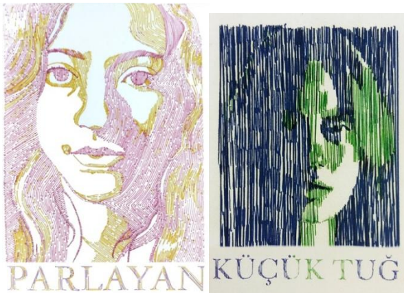
Görsel 25-26: ‘Çizgi-Otoportre’ Başlıklı Proje için Öğrenci Çalışmaları Kaynak: Simay Bahçıvan, Ekim Tuğçe Başel

2016-2017 Eğitim Öğretim Yılında gerçekleştirilen ‘Çizgi-Otoportre’ başlıklı projede ise öğrenciler fotoğrafladıkları kendi otoportrelerini üç tona (siyah, beyaz ve gri) ayırıp, grafik anlatımı sadece çizgi ve renk elemanlarını kullanarak yerine getirmeye çalışmışlardır. Uygulamalarda çizgi elemanı, formu iki boyutlu olarak var ederken, belirli bir disiplinde tekrar edilen çizgiler aynı zamanda dokusal bir yüzey de oluşturmuştur. Siyah, diğer bir deyiş ile koyu alan ile gri alan ayrımı renk faktörünün kullanımıyla gerçekleştirilmiştir. Kimi zaman soğuk renk koyu alanı oluştururken kimi zaman sıcak renk ilişkisi içinde baskın veya daha kontrast olan renk bu görevi üstlenmiştir. Çalışmalardaki tipografik unsurlar daha ziyade bir başlık etkisi taşıırken, resimlemeye has çizgisel doku özelliğinin kullanılmasıyla resimlemenin bir parçasına dönüşmüşlerdir (Görsel 25. ve 26.).