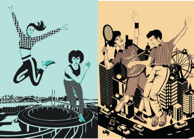
Görsel 36-37: 'Figür-Mekan' Başlıklı Proje için Öğrenci Çalışmaları

Projenin son aşamasında zemine verilmesi planlanan rengin bir ton koyusu figürlerin içinde ara ton üretecek şekilde değerlendirilmiş ve böylece çizgi, leke ve dokusal formlar ile birlikte hacimsel etkiye katkı sağlamışlardır (Görsel 36. ve 37.).