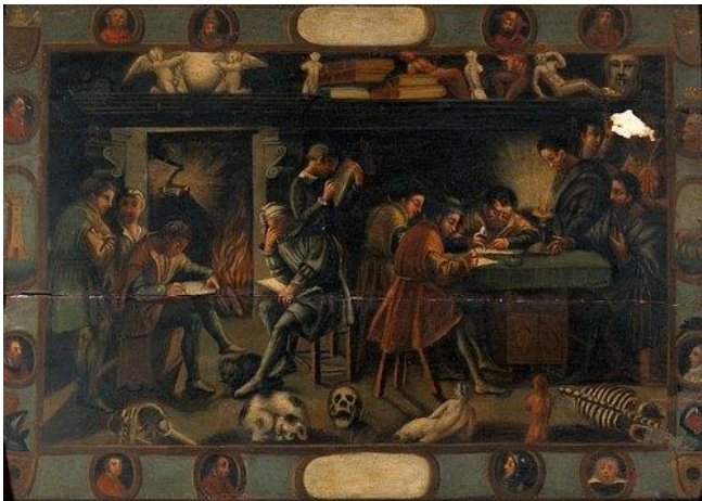
Resim 1: Baccio Bandinelli, Baccio Bandinelli'nin Çizim Atölyesi, 1550

15. yy’da henüz sanat akademilerinin kurulmadığı, okul eğitim sisteminin var olmadığı, çocuk sanatçının usta-çırak ilişkisi ile atölye eğitimi aldığı bir süreç mevcuttur. Atölye eğitimine gelmeden önce ailesi çocuğun temel eğitimini almasını sağlamakta, sonrasında aile çocuğunun yeteneklerini keşfetmekte ve onu yeteneğine uygun bir ustanın yanına çırak olarak vermektedir. Ailenin çocuğuna din bilgisi, felsefe eğitimi, okuma yazma gibi temel bilgilerin çıraklık eğitimi öncesinde verildiği bir sistem mevcut olmuştur. Daha sonra çocuğun bir sanat dalına yatkınlığının aile tarafından fark edilmesi ve bir ustanın yanına eğitim için gönderilmesi söz konusu olmuştur (Resim 1).