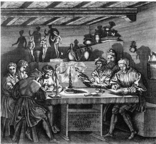
Resim 3: Agostino Veneziano, The Academy of Baccio Bandinelli in Rome, 1531