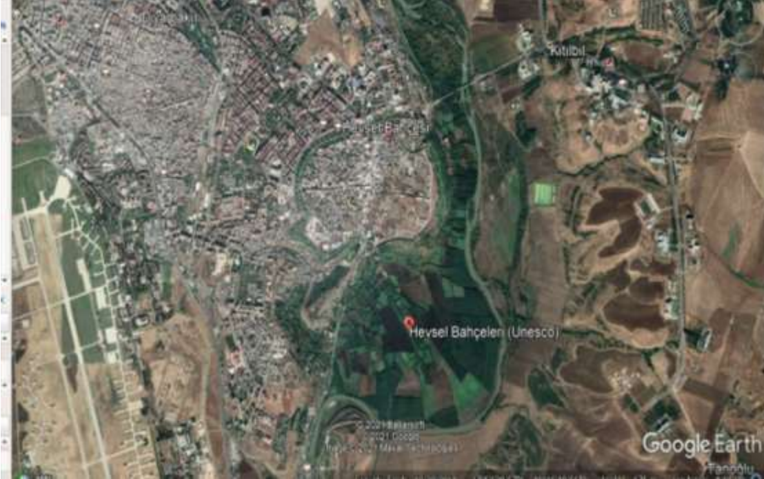
Şekil 2. Hevsel Bahçelerinin Google Earth Görüntüsü.

Diyarbakır il nüfusu 1935 yılında 214142 kişi, 2010 yılında 1528958 ve 2019 yılı Türkiye İstatistik Kurumu verilerine göre 1.756.353 kişi olmuştur. Hevsel bahçelerinin yer aldığı Sur Diyarbakır Büyükşehir olunca ilçe statüsüne getirilmiştir. 2013'de 123311 olan nüfusu, 2016 yılı nüfus verilerine göre % 5,52 azalış ile 116858 gerilemiştir. Sur ilçesi 2015 yılından sonra Diyarbakır ile çevre il ve ilçelerde bölücü terör örgütünün yapmış olduğu terör eylemlerinden olumsuz yönde etkilenmiştir. Terör eylemleri nedeniyle çok sayıda insan Sur ilçesinden göç etmek zorunda kalmıştır. İlçe nüfusu 2015 ve sonrasında azalma eğilimi göstermiştir. Sur ilçe nüfusu 2019 verilerine göre 106.108 kişidir (TUİK, 2020).