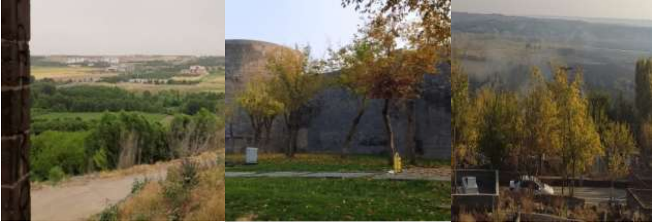
Fotoğraf 1: Hevsel Bahçeleri ve Diyarbakır Surlarından Görünümler

Hevsel bahçeleri, aristokrasiye ve soylu sınıfa ait olmayan bir mekân olmuştur. Her zaman halkın kullanımına açık sivil bir bahçe olarak hem tarımsal hem kültürel ve hem de tarihi olarak özgün bir yerdir. Günümüzde şehir toplumlarında doğayla ilişkilerinin sürdürülebildiği, her şeyin doğal olduğu bir nebze "sığınma mekânları" olarak da büyük önem taşımaktadır. Ayrıca bahçeler mesire, eğlenme, dinlenme yeri olarak kamusal bir mekân olmuştur (Fotoğraf.2 ) (Gümüş,2015).