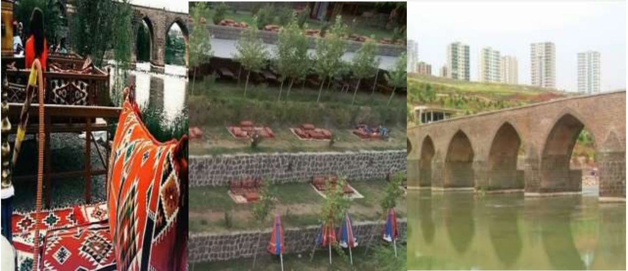
Fotoğraf 2: On Gözlü Köprü ve Hevsel Bahçeleri Etrafındaki Rekreasyon Alanları