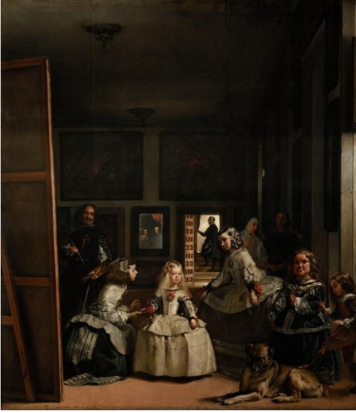
Resim 2:Diego Velazquez, Nedimeler, 1656, Yağlıboya, 318x276cm, Prado Müzesi, Madrid