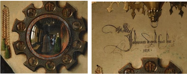
Resim 1'den ayrıntılar

Eser, meşe üzerine yağlı boya tekniği ile yapılmıştır.Çalışmaya bakıldığında, merkezde iki figür bulunduğu görülmektedir. Figürler İtalyan Rönesans'ında hâkim olan kusursuz anatomik özelliklerden uzak bir şekilde resmedilmiştir. Figürler iç mekân içerisinde konumlandırılmış,çiftin çevresine sembolik anlamlar yüklü olduğu düşünülen nesnelere yerleştirilmiştir. Bunlardan ilki çiftin arasına konumlandırılmış köpek figürüdür. Bu köpeğin sadakati simgelediği yorumu yapılabilir. Köpeğin biraz ilerisinde erkek figüre ait olduğu düşünülen tahta dokuya sahip terlikler olduğu görülmektedir.Çalışmanın gerisinde ise kadın figüre ait kırmızı terlikler konumlandırılmış durumdadır. Resmin tek ışık kaynağı sol tarafta bulunan penceredir. Pencereden gelen ışıkla bir kısmı aydınlanan bir diğer nesne tavanda asılı duran avizedir. Avize oldukça detaylı resimlenmiştir ve üzerinde dört mum haznesi olan avizenin üzerinde yalnız bir mumun yanmış şekilde resmedildiği görülmektedir. Yanan mumun da sembolik ve dini bir anlam taşıdığı düşünülebilir. Avizenin hemen altında ise dış bükey bir ayna konumlandırılmıştır. Aynanın etrafı dini hikâyeleri konu alan küçük resimlerle çevrilidir. Bu ayna resim içerisinde bir resim daha görülmesine olanak sağlamıştır. Böylelikle ayna, sanatçının da orada olduğunu belgeleyerek resim içerisinde görünenden fazla figür olduğu fikrini uyandırmıştır. Bu yönden bakıldığında mekânı farklı bir açı ile sunduğu yorumu yapılabilir.