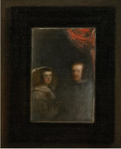
Resim 2'den ayrıntılar

Bu doğrultuda Kral ve Kraliçe gölgeli alan içerisinde oluşturulan aydınlık bir yansıma da resme dâhil olmuşlardır. Böylece tabloda yer alan kişiler izleyiciye değil, izleyici yerine konumlandırılmış kral ve kraliçe'ye yönlendirilmiştir.