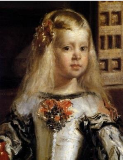
Resim 2'den ayrıntılar

Bu bağlamda “Nedimeler” isimli tabloya bakıldığında, çalışma tuval üzerine yağlı boya tekniği kullanılarak yapılmıştır. Resim içerisinde 10 insan figürü ve 1 köpek figürüne yer verildiği görülmektedir. Resimde ortada, aydınlık alanda prenses olduğu düşünülen figür yer almaktadır. Prensesin etrafında esere ismini veren nedimleri, bir cüce, mürebbiyesi ve diğer hizmetkârlar resmedilmiştir.