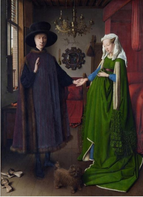
Resim1:Jan Van Eyck (1434), Meşe Panel üzerine yağlı boya, 82x60 cm, National Gallery, Londra, Birleşik Krallık. Web: https://tr.wikipedia.org/wiki/Dosya:Van_Eyck_-_Arnolfini_Portrait.jpg 07.03.2022,(23.36) tarihinde alınmıştır.

Eser, meşe üzerine yağlı boya tekniği ile yapılmıştır.Çalışmaya bakıldığında, merkezde iki figür bulunduğu görülmektedir. Figürler İtalyan Rönesans'ında hâkim olan kusursuz anatomik özelliklerden uzak bir şekilde resmedilmiştir. Figürler iç mekân içerisinde konumlandırılmış,çiftin çevresine sembolik anlamlar yüklü olduğu düşünülen nesnelere yerleştirilmiştir. Bunlardan ilki çiftin arasına konumlandırılmış köpek figürüdür. Bu köpeğin sadakati simgelediği yorumu yapılabilir. Köpeğin biraz ilerisinde erkek figüre ait olduğu düşünülen tahta dokuya sahip terlikler olduğu görülmektedir.Çalışmanın gerisinde ise kadın figüre ait kırmızı terlikler konumlandırılmış durumdadır. Resmin tek ışık kaynağı sol tarafta bulunan penceredir. Pencereden gelen ışıkla bir kısmı aydınlanan bir diğer nesne tavanda asılı duran avizedir. Avize oldukça detaylı resimlenmiştir ve üzerinde dört mum haznesi olan avizenin üzerinde yalnız bir mumun yanmış şekilde resmedildiği görülmektedir. Yanan mumun da sembolik ve dini bir anlam taşıdığı düşünülebilir. Avizenin hemen altında ise dış bükey bir ayna konumlandırılmıştır. Aynanın etrafı dini hikâyeleri konu alan küçük resimlerle çevrilidir. Bu ayna resim içerisinde bir resim daha görülmesine olanak sağlamıştır. Böylelikle ayna, sanatçının da orada olduğunu belgeleyerek resim içerisinde görünenden fazla figür olduğu fikrini uyandırmıştır. Bu yönden bakıldığında mekânı farklı bir açı ile sunduğu yorumu yapılabilir.