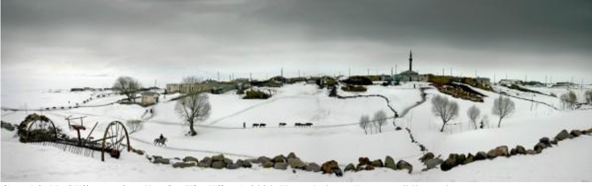
Görsel 3: Nuri Bilge Ceylan, Kasaba (The Village) , 2004.

Nuri Bilge Ceylan'ın Kasaba filmindeki (Görsel 3) sahnelerin yer aldığı fotoğraflarına bakıldığında Bruegel etkisi açıkça fark edilmektedir. Ceylan da tıpkı Bruegel gibi kadrjalarını geniş bir yelpazede ele almaktadır. Eser, toplum ve taşra ilişkisi bağlamında incelendiğinde, toplumun sorunları ve doğanın toplumla olan birlikteliği fark edilmektedir. Doğa imgesi, yaşam barındıran her bölgenin farklı koşullarından doğan toplum ilişkisini var etmektedir. Bu sahneler incelendiğinde durağan gibi gözükken, bütünü ve kompozisyonu tamamlayan hareketli imgeler fark edilmektedir. Nuri Bilge Ceylan, durağan nesnelere üzerine anlam yükler. Aynı zamanda eserlerinde toplum-kimlik çatışması ön plana çıkmaktadır.