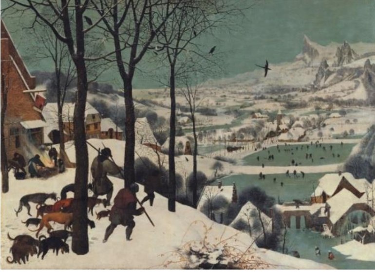
Görsel 1: Pieter Bruegel, Karda Avcılar (Jagers in de Sneeuw) , 1565. Kaynak: https://oggito.com

Bu bağlamda hem Bruegel’in hem de Ceylan’ın eserlerindeki benzerlik kuşbakışı ve geniş bir pencereden bakmalarıdır. Her iki sanatçıda da detaylara verilen önem ve figürlerin sıradanlığı dikkat çekmektedir.