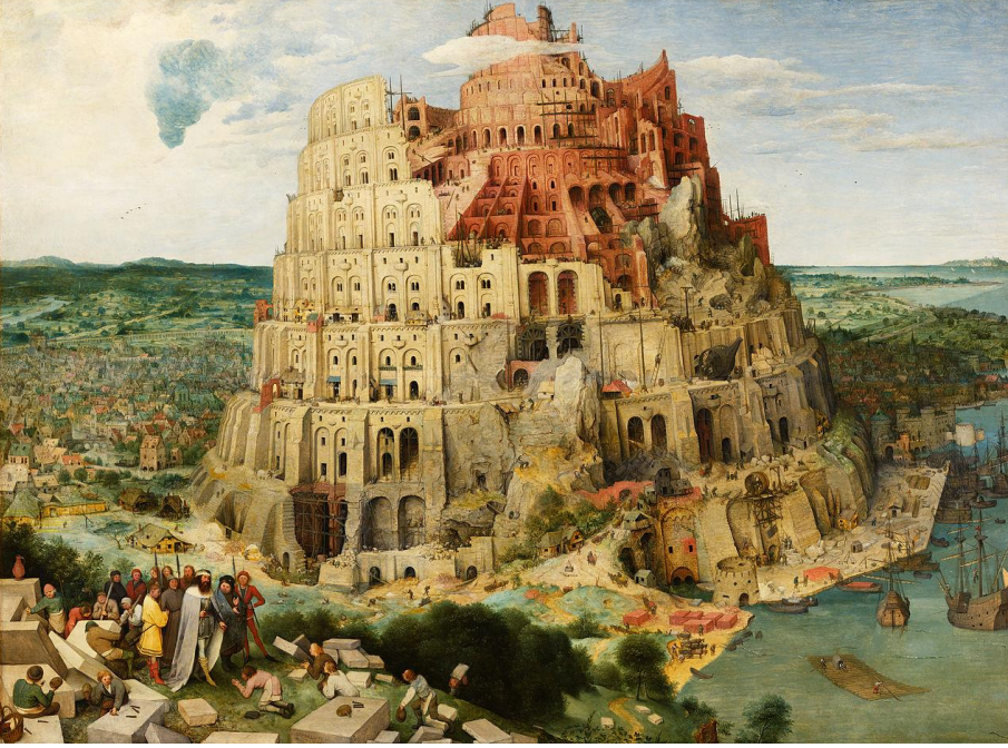
Görsel 6: Pieter Bruegel, Babil Kulesi , ( The Tower of Babel ), 1563.

Bruegel'in The Harvesters (Görsel 4) ve Ceylan'ın Bir Zamanlar Anadolu'da (Görsel 5) filmindeki sahnelerine bakıldığında, sağ tarafına doğru konumlandırılmış yüksek bir ağaç ve etrafında şekillenmiş farklı figürler görülmektedir. The Harvesters sahnesinde bir buğday tarlasında çalışmaktan yorulmuş bir grup işçinin büyük bir ağacın gölgesinde dinlendikleri ve yemek yedikleri, diğer bir grubun işin bitmesi için dinlenmeden çalışmaya devam ettikleri, daha uzaklarda sıksa bir adamın yüzdüğü görülmektedir. Resmin merkezindeki ağaç, toplumun gündelik hayatını ele alan bir imgeyi temsil etmektedir. Bu bakımdan ağaç imgesi heybetli ve diri bir biçimde durmaktadır. Bruegel, toplum sorunlarını ve bu sorunları ele alış biçimlerini geniş bir manzaranın içerisine konumlandırmaktadır. Ceylan, Bruegel'in resminden referans alarak kendi ifade biçimine dönüştürmüştür. Ceylan'ın sahnesinde de bir bakıma toplayıcılar görülmektedir. Bruegel'in resminde hasat toplayanlar görülürken Ceylan'ın sahnesinde delil toplayanlar görülmektedir. Bu yüzden Ceylan'ın sahnelerinde metaforik anlatım öne çıkmaktadır.