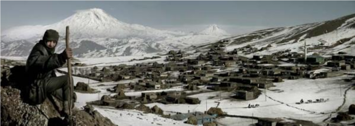
Görsel 2: Nuri Bilge Ceylan, Village boy near Mount Ararat (Ararat), 2004.

Bruegel’in Karda Avcılar isimli eserindeki (Görsel 1) figürlerde belirli bir düzen yoktur. Aksine resimdeki kompozisyon içerisinde farklı yöne dağılmışlardır. Figürlerin doğayla kompozisyonu, izleyiciyi evren ve insan arasındaki birliktelik olgusuna itmektedir. Bruegel, geniş peyzajında dağınık gibi gözükken bir kompozisyona yer vermesine rağmen detayların resmin tamamlayıcı birer parçaları olduğunu gösterir. Bruegel’in resmine sol taraftaki avcılardan itibaren bakıldığında yukarıdan aşağıya doğru bir bakış görülmektedir. Bruegel, ağaçları da aynı perspektifte resmederek ritmik bir hareket hissettirmektedir. Esere ilk bakıldığında, rastgele konumlandırılmış bir sahne görülebilir; ancak esere detaylı baktığında geniş bir perspektif içerisinde eş zamanlı olay örgüsü ile karşılaşmaktadır.