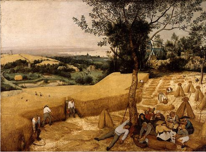
Görsel 4: Pieter Bruegel, The Harvesters , 1565.

Nuri Bilge Ceylan'ın Kasaba filmindeki (Görsel 3) sahnelerin yer aldığı fotoğraflarına bakıldığında Bruegel etkisi açıkça fark edilmektedir. Ceylan da tıpkı Bruegel gibi kadrjalarını geniş bir yelpazede ele almaktadır. Eser, toplum ve taşra ilişkisi bağlamında incelendiğinde, toplumun sorunları ve doğanın toplumla olan birlikteliği fark edilmektedir. Doğa imgesi, yaşam barındıran her bölgenin farklı koşullarından doğan toplum ilişkisini var etmektedir. Bu sahneler incelendiğinde durağan gibi gözükken, bütünü ve kompozisyonu tamamlayan hareketli imgeler fark edilmektedir. Nuri Bilge Ceylan, durağan nesnelere üzerine anlam yükler. Aynı zamanda eserlerinde toplum-kimlik çatışması ön plana çıkmaktadır.