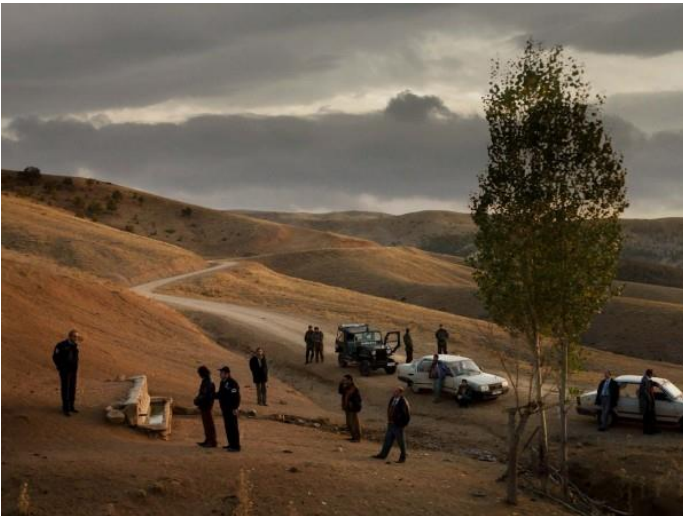
Görsel 5: Nuri Bilge Ceylan, Bir Zamanlar Anadolu'da , 2011.