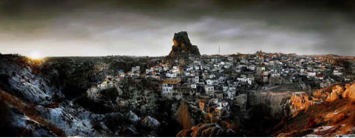
Görsel 7: Nuri Bilge Ceylan, Kapadokya'da bir Köy ( Village in Cappadocia ), 2003.