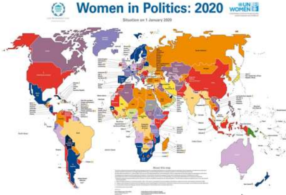
Şekil 1. Kadınların Politikada Yer Alma Durumu

T.C. İçişleri Bakanlığı Araştırma ve Etütler Merkezi (AREM, 2008) tarafından Birleşmiş Milletler Kadın ve Kız Çocuklarının İnsan Haklarının Korunması ve Geliştirilmesi Ortak Programı çerçevesinde 78 ülkede yapılan araştırmada; kadın belediye başkanlarının oranının sadece yüzde 9 olduğunu göstermektedir. Yerel meclis üyesi kadınların oranı ise yüzde 20,9'dur. 2008 yılında il genel meclislerindeki kadın üye oranı %2,37'dur. Birleşmiş Milletlerin kadın birimi (UN Women, 2020) parlamento düzeyindeki kadın oranını araştırıp rapor hazırlamaktadır. Şekil 1'de dünya siyasetinde kadın varlığının dağılımı görülmektedir. Parlamentolardaki kadın milletvekili oranı 2020 yılında %24,9 olarak görülmektedir. Siyasette kadının yerini sorgulayan bu araştırmada Türkiye 189 ülke arasından 122.sıradadır.