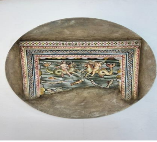
Şekil 22. Hippokampos Mozaik Desenli Tablo