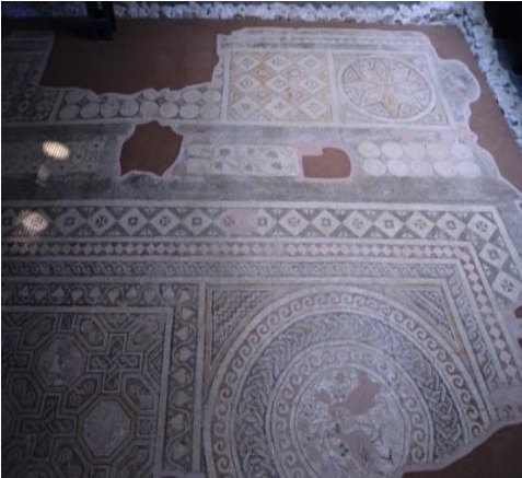
Şekil 6. Su Gözü Mozaïği, MS. 4. Ve 5. Yüzyıla ait (Roma dönemi) Adana, Yumurtalık, Su gözü Köyünde Bazilika planlı kilise zemin döşemesine aittir. Adana Arkeoloji Müzesinde sergilenmektedir.

Su Gözü Mozaikleri: Ana mekânda yer alan mozaik, geometrik motifler ile üç panoya ayrılmıştır. Daire panonun içinde ortada hayat ağacı ve karşılıklı iki tavus kuşu figürü betimlenmiştir. Ortadaki dikdörtgen pano bitkisel bezeli geniş bir bant ile çevrelenmiştir. Haç şekillerinin içinde giyoş (ikili örgü), altıgen içlerinde ‘‘S’’ kıvrım yapan sarmallar, sekizgen panolarda ise bitkiler arasında çeşitli hayvan figürleri ile bezenmiştir. Soldaki nefte yer alan mozaik döşemesinde düz bantlardan dikdörtgen ve kare panolar oluşturulmuştur. Kare panolar geometrik motifler, dikdörtgen panolar ise daire dizisi ve halı deseni ile bezenmiştir (Patacı 2019:313).