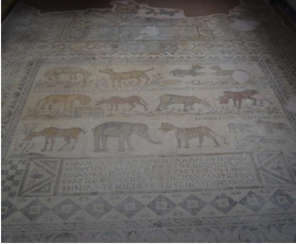
Şekil 8. Barış Krallığı Mozaïği, Adana, Sarıçam Karlık köyüne ait Bazilikal kilisesi tabanına aittir. M.S. 6. Yüzyıla aittir. Adana Arkeoloji Müzesinde sergilenmektedir.

Barış Krallığı Mozaïği: Kitab-ı mukaddes'in Yeşeya kitabı XI. Bölümünde bahsedilen Barış krallığı konusu resim ve yazıyla betimlenmiştir. Hayvan çiftleri barışçıl bir biçimde tasvir edilmiş olup üzerinde "kurt kuzuyla otluyor, leopar yanında yatıyor buzağı aslanın yemini yiyor, boğa ve ayı da yan yana otlayacaklar" yazıları yer almaktadır. Adak yazıtları Khoreos oğlu LoannesPistakos, Kandalaramon olarak görev yaparken kendisinin ve ailesinin selameti için bazilikanın mozaïğini on üçüncü Indiktion'daArtemision ayında yaptırdı." ve " bu mozaik saygıdeğer rahip Sambatios ve Baş DiakonKyriakos zamanında on üçüncü Indiktin'daArtemision ayında döşendi." olarak çevrilmektedir (Bozkurt, 2023.www.anadolu-mozaïği).