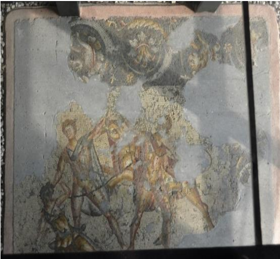
Şekil 12. Dirke Mozaïği, Adana'nın Seyhan ilçesinde Abidinpaşa Caddesindeki Merkez Bankası hafriyatında antik bir yapının tabanıdır. MS 4. Yüzyıla ait olduğu düşünülmektedir. Adana Arkeoloji Müzesinde sergilenmektedir.

Dirke Mozaïği: Antik dönem sanatında nadir işlenen mitolojik bir konu olan Dirke'nin cezalandırılması tasvir edilmiştir. Mozaik panosunda Zeus ve Antipope'nin çocukları olan Amphion ve Zethos boğanın boynuzlarını tutmakta Dirke'nin saçlarından tutarak arka plandaki boğaya doğru sürüklemektedir. Dirke'nin dizelerinin üzerinde sürüklemesi ve boğaya ipe bağlanma anı betimlenmiştir. Mozaik panosu siyah zemin üzerine akanthus yaprağı, çiçek motifleri ve kıvrık dallardan oluşan bitkisel geniş bir bantla sınırlandırılmıştır. Sarmal yapan kıvrık dallar arasında aslan ve domuz figürleri yer almaktadır (Bozkurt, 2023. www.anadolu-mozaiği).