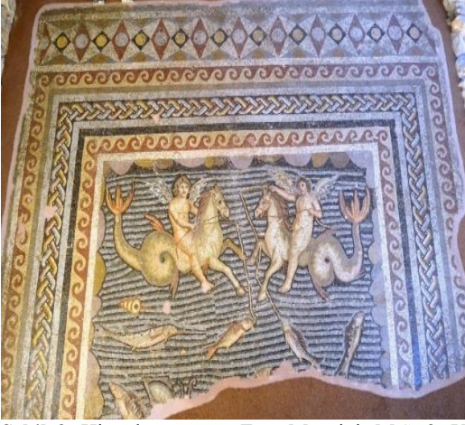
Şekil 3. Hippokampos ve Eros Mozaïği. M.S. 2. Yüzyılın ortalarına ait Adana, Yumurtalık da Aigeia antik kentindeki villa taban döşemesinden çıkarılmıştır. Adana Arkeoloji Müzesinde sergilenmektedir.

Tethys Mozaïği 1: Mozaïğin merkezinde Tethys, solunda gemi dümeni, başının iki yanında ve sağ omzunda Ketos (deniz ejderhası) ve panonun dört köşesinde balık avlayan eroslar betimlenmiştir. Tethys tasvirlerinde başının üzerinde genellikle kanatlar bulunmaktadır. Buradaki Tethys tasvirinde ise başının iki yanında yengeç ya da ıstakoz kıskacı bulunmaktadır. Panonun üst köşelerinde serpmme ağla balık avlayan eroslar, alt köşelerinde ise olta ile balık avlayan eroslar tasvir edilmiştir. Panonun geriye kalan boşluk alanlarında yunus, istavrit, uskumru, orfoz, mezgit, zargana, levrek türünden balıklar yengeç, ıstakoz, ahtapot gibi deniz canlıları betimlenmiştir.