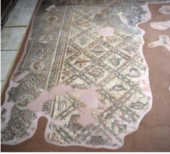
Şekil 7. Faydalı Köyü Mozaïği, M.S. 6. Yüzyıl ortalarına ait Adana, İmamoğlu, Faydalı Köyü, Bazilika planlı kilise tabanına aittir. Adana Arkeoloji Müzesinde sergilenmektedir.

Barış Krallığı Mozaïği: Kitab-ı mukaddes'in Yeşeya kitabı XI. Bölümünde bahsedilen Barış krallığı konusu resim ve yazıyla betimlenmiştir. Hayvan çiftleri barışçıl bir biçimde tasvir edilmiş olup üzerinde "kurt kuzuyla otluyor, leopar yanında yatıyor buzağı aslanın yemini yiyor, boğa ve ayı da yan yana otlayacaklar" yazıları yer almaktadır. Adak yazıtları Khoreos oğlu LoannesPistakos, Kandalaramon olarak görev yaparken kendisinin ve ailesinin selameti için bazilikanın mozaïğini on üçüncü Indiktion'daArtemision ayında yaptırdı." ve " bu mozaik saygıdeğer rahip Sambatios ve Baş DiakonKyriakos zamanında on üçüncü Indiktin'daArtemision ayında döşendi." olarak çevrilmektedir (Bozkurt, 2023.www.anadolu-mozaïği).