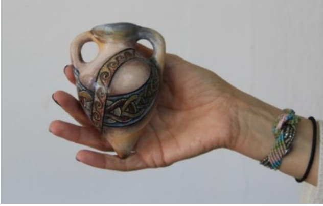
Şekil 13. Su gözü Mozaikli Amfora

Bu ürün Adana olgunlaşma Enstitüsü seramik bölümünde hazırlanmıştır. Adana, Yumurtalık, Sugözü Köyünde Bazilikal planlı kilise zemin döşemesine ait olan Su Gözü mozaïği desenlerinden faydalanılarak çalışılmıştır. Çalışılan ürünün adı amforadır. El ile şekillendirilmiştir. İçerisine şarap, yağ vs sıvı maddeler konulması için kullanılan bir nesnedir. İki defa pişirimi yapılmıştır. Malzeme olarak beyaz çamur ve seramik boya ları kullanılmıştır. Çini ve akrilik boya lar ile süslemeleri tamamlanmıştır.