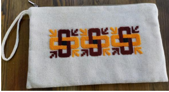
Şekil 20. Solomon Düğümü Mozaik Desenli Boncuk İşlemeli Çanta

Osmaniye Kadirli Flaviapolis Antik Kentinde çıkarılan mevsimler mozaiği motifinden faydalanılarak çalışılmıştır. Ürün 30x40 ebatında olup kesme ve dövme(kraft) tekniği ile çalışılmış, akrilik boya ve deri boyası ile renklendirilerek çalışma tamamlanmıştır.