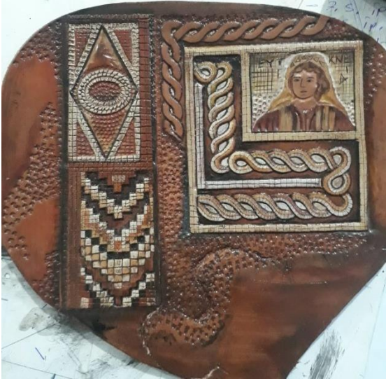
Şekil 19. Mevsimler Mozaiği Desenli Deri Tablo

Osmaniye Kadirli Flaviapolis Antik Kentinde çıkarılan mevsimler mozaiği motifinden faydalanılarak çalışılmıştır. Ürün 30x40 ebatında olup kesme ve dövme(kraft) tekniği ile çalışılmış, akrilik boya ve deri boyası ile renklendirilerek çalışma tamamlanmıştır.