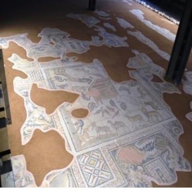
Şekil 1. Nuh'un Gemisi Mozaği, MS 5. Yüzyılın ilk yarısı (Roma Dönemi) Adana / Yüreğir / Misis – Mopsuestia antik kentinden çıkarılmıştır, Adana Arkeoloji Müzesinde sergilenmektedir.

eşek, ceylan ve deve yer almaktadır. Mozağin kuzeybatı kısımları özensiz bir şekilde onarılmıştır. Buradaki insan figürlerinin Nuh'un oğulları Sam ve Yâfes'i temsil ettiği düşünülmektedir (Bozkurt, 2023.www.anadolu-mozaiği).