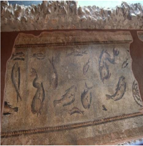
Şekil 10. Deniz Mozaïği, Adana, Kozan da bulunan Dilekkaya Köyünde Anavarza antik kentine ait yapılardan birinin taban kısmıdır. M.S. 4. Yüzyıl ortalarına aittir. Adana Arkeoloji Müzesinde sergilenmektedir.

Deniz Mozaïği: Mozaik panosunda deniz betimlemesinde kullanılan yunuslar, balıklar, ahtapot, mürekkep balığı ve kalamar türünden canlılar betimlenmiştir. Mozaik, beyaz zemin üzerinde düz bant ve testere dişi motiflerden oluşan bir bantla sınırlandırılmıştır. Roma dönemi mozaik sanatında balıklar ve deniz canlılarının betimlendiği deniz mozaikleri Akdeniz dünyasında sevilerek kullanılmıştır. Antik dönemin deniz tasvirleri, Akdeniz'in zengin türlerine ışık tutmaktadır. Deniz mozaikleri Roma dönemi evlerinin ziyafet odalarını, avlularını ve havuz tabanlarını süslemektedir (Boulad, 2023:64).