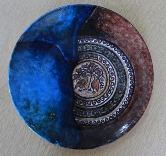
Şekil 14. Su Gözü Seramiği Tabak

Bu ürün Adana olgunlaşma Enstitüsü seramik bölümünde hazırlanmıştır. Adana, Yumurtalık, Sugözü Köyünde Bazilikal planlı kilise zemin döşemesine ait olan Su Gözü mozaïği desenlerinden faydalanılarak çalışılmıştır. Çalışılan ürünün adı amforadır. El ile şekillendirilmiştir. İçerisine şarap, yağ vs sıvı maddeler konulması için kullanılan bir nesnedir. İki defa pişirimi yapılmıştır. Malzeme olarak beyaz çamur ve seramik boya ları kullanılmıştır. Çini ve akrilik boya lar ile süslemeleri tamamlanmıştır.