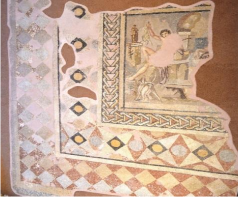
Şekil 2. Artemis'e Sunu Mozaği, M.S.2.Yüzyılın ortalarında (Roma dönemi) Adana Yumurtalık Aigeia antik kentinden çıkarılmıştır. Adana Arkeoloji Müzesinde sergilenmektedir.

Artemis'e Sunu Mozaği: Mozaikte Aigeia antik kentinden bir manzara ve Artemis'e sunu sahnesi betimlenmiştir. Panonun sol tarafında bitkiler arasında yüksek bir kaide üzerinde Artemis heykeli, panonun merkezinde arka planda deniz ve limanda ada üzerinde yer alan bir deniz feneri betimlenmiştir. Mozağin merkezinde koltuklarına oturmuş vaziyette bir erkek ve bir kadın figürü betimlenmiştir. Soldaki figür sağ eliyle ayaklarından tuttuğu tavşanı yukarı kaldırarak Artemis'e sunmaktadır. Antik dönem mozaik sanatında av köpekleri ile tavşan avı sporu ve avın Artemis'e sunulması, sevilerek işlenen konuların arasında yer almaktadır (Boulad, 2023:16).