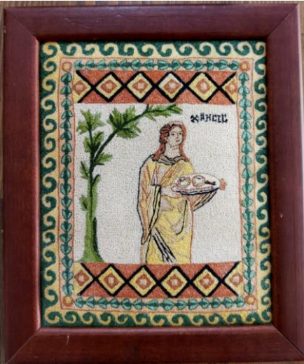
Şekil 18. Roma Dönemi Mozaik Sahnesi Desenli Nakışlı Tablo

Nakış işleme ile yapılan bu kese Adana Olgunlaşma Enstitüsü nakış üretim atölyesinde işlenmiştir. Keten kumaş üzerine koton ipliklerle işlenmiştir. M.S. 2. Yüzyılın ortalarına ait Adana, Yumurtalık da Aigeia antik kentindeki villa taban döşemesinden çıkarılan Hippokampos ve Eros Mozaikine ait desenler stilize edilip tasarımı yapılmıştır. Kanaviçe ve susma teknikleri kullanılarak işleme yapılmıştır.