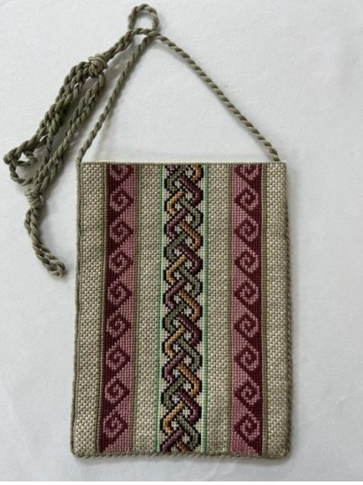
Şekil 17. Hippokampos mozaik Desenli Nakışlı Çanta

Adana Olgunlaşma Enstitüsü Kuyumculuk bölümü üretim atölyesinde üretilen bu broş Adana mozaik desenlerinden tasarlanmıştır. Pirinç ve bronz metallere yapılmıştır. Kuyumculuk sanatına ait ajur ve kabartma teknikleri kullanılarak şekillendirilmiştir.