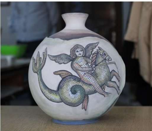
Şekil 15. Hippokampos Mozaik Desenli Vazo

Adana Yumurtalık, Su gözü Köyünde Bazilikal planlı kilise zemin döşemesine ait olan Su Gözü mozaïği desenlerinden faydalanılarak çalışılmıştır. Çalışılan ürün dekor amaçlı kullanılan tabaktır. Beyaz çamur kalıpla tabak biçiminde şekillendirilmiş ardından fırında pişirimi yapılmıştır. Çini boya ları ve akrilik boya lar kullanılarak üzerine desen süslemesi yapılmıştır.