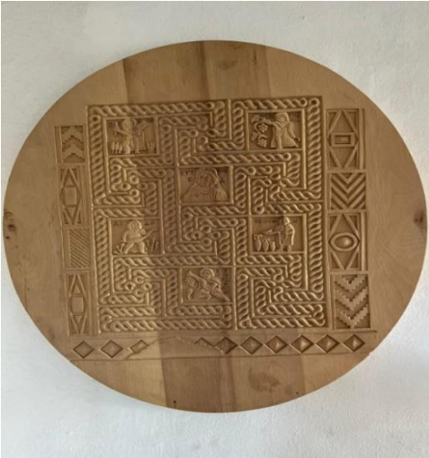
Şekil 23. Ağaç Oyma Duvar Panosu