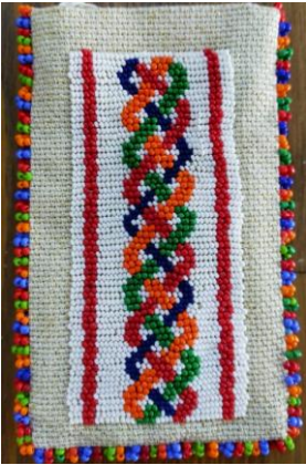
Şekil 21. Gıyoş Mozaik Deseninden Boncuk İşlemeli Çanta

Osmanlı Kadirli Flaviapolis Antik Kentinden çıkarılan Solomon Düğümlü mozaik deseninden esinlenerek çalışılmıştır. Ürün çalışılırken desenin şeması takip edilerek tek atışlı goblen tarzında işlenmiş, 33x20 boyutunda el çantası olarak yapılmıştır.