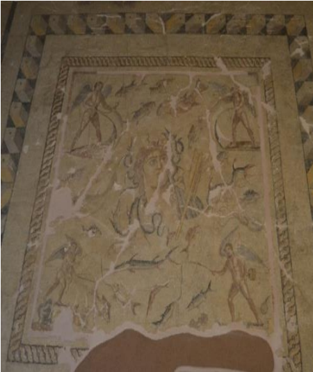
Şekil 4. Tethys Mozaïği. M.S. 2. Yüzyılın ortalarına ait Adana, Yumurtalık da Aigeia antik kentindeki villa taban döşemesinden çıkarılmıştır. Adana Arkeoloji Müzesinde sergilenmektedir.

Tethys Mozaïği 1: Mozaïğin merkezinde Tethys, solunda gemi dümeni, başının iki yanında ve sağ omzunda Ketos (deniz ejderhası) ve panonun dört köşesinde balık avlayan eroslar betimlenmiştir. Tethys tasvirlerinde başının üzerinde genellikle kanatlar bulunmaktadır. Buradaki Tethys tasvirinde ise başının iki yanında yengeç ya da ıstakoz kıskacı bulunmaktadır. Panonun üst köşelerinde serpmme ağla balık avlayan eroslar, alt köşelerinde ise olta ile balık avlayan eroslar tasvir edilmiştir. Panonun geriye kalan boşluk alanlarında yunus, istavrit, uskumru, orfoz, mezgit, zargana, levrek türünden balıklar yengeç, ıstakoz, ahtapot gibi deniz canlıları betimlenmiştir.