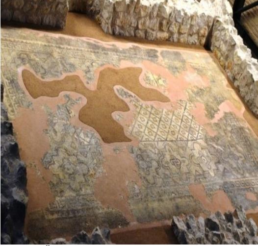
Şekil 9. Üç Çam Mozaïği, Adana, Sarıçam, Karlık Köyü mevkiinde Bazilikal planlı kilise tabanına aittir. M.S. 6. Yüzyıl ortalarına aittir. Adana Arkeoloji Müzesinde sergilenmektedir.

Deniz Mozaïği: Mozaik panosunda deniz betimlemesinde kullanılan yunuslar, balıklar, ahtapot, mürekkep balığı ve kalamar türünden canlılar betimlenmiştir. Mozaik, beyaz zemin üzerinde düz bant ve testere dişi motiflerden oluşan bir bantla sınırlandırılmıştır. Roma dönemi mozaik sanatında balıklar ve deniz canlılarının betimlendiği deniz mozaikleri Akdeniz dünyasında sevilerek kullanılmıştır. Antik dönemin deniz tasvirleri, Akdeniz'in zengin türlerine ışık tutmaktadır. Deniz mozaikleri Roma dönemi evlerinin ziyafet odalarını, avlularını ve havuz tabanlarını süslemektedir (Boulad, 2023:64).