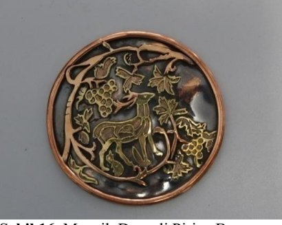
Şekil 16. Mozaik Desenli Pirinç Broş

desen çizilmiştir. Seramik ve çini boyaları ile boyanmış sırlanma işlemi tamamlandıktan sonra kullanıma hazır hale gelmiştir.