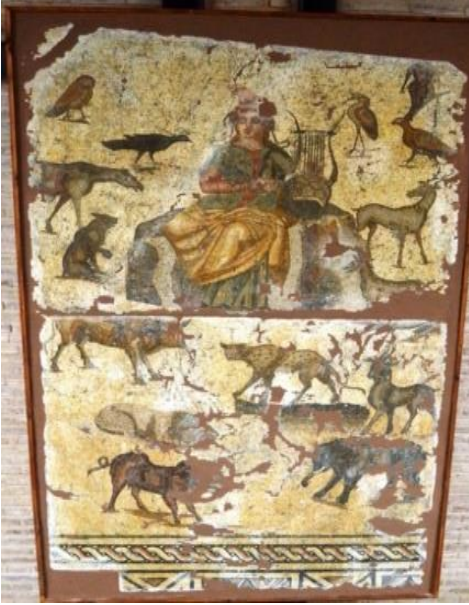
Şekil 11. Orpheus Mozaïği, Adana'nın Seyhan ilçesinde Abidinpaşa Caddesindeki Merkez Bankası hafriyatında antik bir yapının tabanıdır. MS 4. Yüzyıla ait olduğu düşünülmektedir. Adana Arkeoloji Müzesinde sergilenmektedir.

Dirke Mozaïği: Antik dönem sanatında nadir işlenen mitolojik bir konu olan Dirke'nin cezalandırılması tasvir edilmiştir. Mozaik panosunda Zeus ve Antipope'nin çocukları olan Amphion ve Zethos boğanın boynuzlarını tutmakta Dirke'nin saçlarından tutarak arka plandaki boğaya doğru sürüklemektedir. Dirke'nin dizelerinin üzerinde sürüklemesi ve boğaya ipe bağlanma anı betimlenmiştir. Mozaik panosu siyah zemin üzerine akanthus yaprağı, çiçek motifleri ve kıvrık dallardan oluşan bitkisel geniş bir bantla sınırlandırılmıştır. Sarmal yapan kıvrık dallar arasında aslan ve domuz figürleri yer almaktadır (Bozkurt, 2023. www.anadolu-mozaiği).