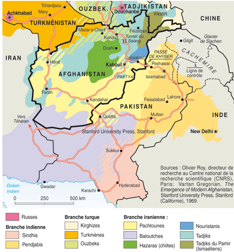
Harita 3. Afganistan ve Pakistan'ın Etnik Dağılımı 2

Afganistan'da Farsça'nın resmi dil olması ve Hazaralar ile Taciklerin Farsça konuşmaları, İran'ın bu iddialarını güçlendirmektedir. 1