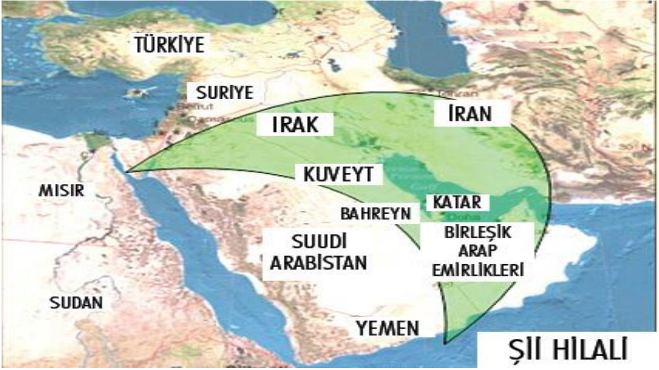
Harita 1. Şii Hilali 1

Şii Hilali kavramının dünya gündemine oturması, ABD'nin 2003 yılında Irak'ı işgal etmesinden sonra, Iraklı Şiiilerin Kürtlerle birlikte yönetimde başat aktör olmalarıyla başlamıştır. Iraklı Şiiilerin ülkenin yönetimini ele almalarıyla birlikte, önemli bir Şii nüfus barındıran Suudi Arabistan, Bahreyn ve Kuveyt gibi Arap ülkelerinde ciddi iç güvenlik sorunlarının başlayabileceği endişeleri yaşanmıştır. 2 ABD müdahalesi sonrasında Irak'ta Şiiilerin en güçlü siyasi oluşum olarak ortaya çıkmaları ve 2006 yılında Lübnan'da yaşanan Hizbullah-İsrail savaşından sonra İran destekli Şii Hizbullah'ın önemli bir güç kazanması, bölgede İran merkezli Şiilik kaygılarını artırmıştır. 3