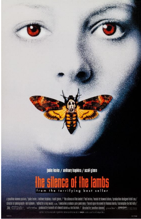
Şekil 1. Kuzuların Sessizliği