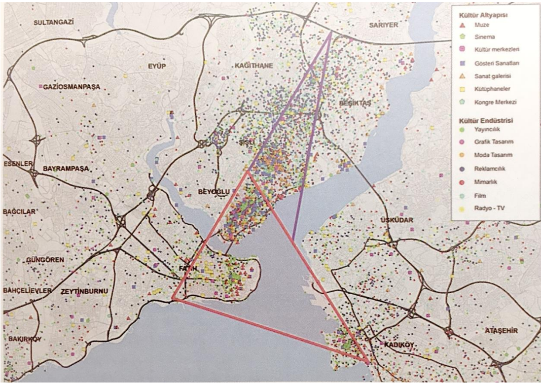
Şekil 2. : İstanbul kültür ekonomisi kültür altyapılarının coğrafi dağılımı ve kültür ekonomilerini oluşturan işkollarında faaliyet gösteren firmaların yer seçimleri Kaynak: (Aksoy ve Enlil, 2011)

Aksoy ve Enlil (2011), Kültür Ekonomi Envanteri İstanbul 2010 çalışmalarında kültür ekonomisinin mekânsal analizini yapmışlar ve daha önce ortaya konulmuş olan kültür üçgenine ek olarak İstanbul'un merkezi iş alanının yer aldığı Levent-Maslak hattı ve yakın çevresini de katmışlardır.