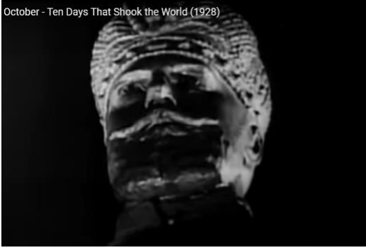
Şekil 2. October filminden sahne. Sergei Eisenstein,1927

October - Ten Days That Shook the World (1928)