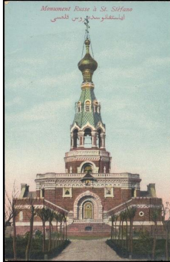
Şekil 8. Ayastefanos'ta Rus Abidesi

Ruslar ise anlaşma sonrası Osmanlı devletinden Rus zaferini simgeleyen bir anıt yapılmasını istemişlerdir. II.Abdülhamit her ne kadar itiraz etse de , savaşta ölen 5000 rus askeri için 1895 yılında Rus mimar Bozarov tarafından anıt projelendirilmiş ve yapılmıştır (Şekil 8.). Üç yıl süren inşaat sonucu son derece görkemli bir yapı elde edilmiştir. (Ayastefanos Rus Abidesi, 2021)