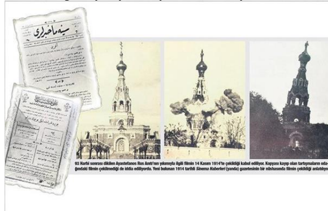
Şekil 11 Ayastefanos'taki Rus Abidesinin Yıkılışı – 1914