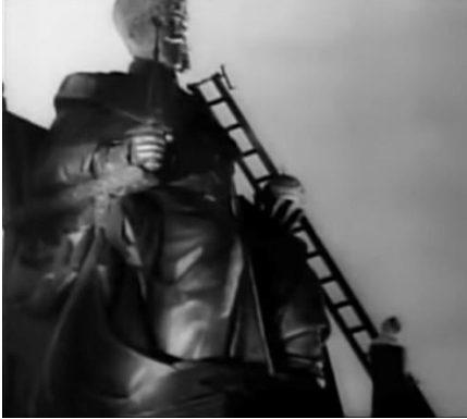
Şekil 4. October filminden sahne. Sergei Eisenstein,1927