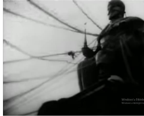
Şekil 5. October filminden sahne. Sergei Eisenstein,1927

Heykelin devasa boyutta olduğunu genel planda heykelin üzerine tırmanan figürler vasıtasıyla anlaşılır. Heykel, işçiler tarafından iplerle bağlanır ve yıkılır (Şekil 5). Sahnenin devamında ‘Şubat. Sosyalizm yolunda yürüten işçilerin ilk zaferi.’ yazısıyla karşılaşıyoruz ve yıkılan heykelin Rus İmparatoru II. Alexander’a ait olduğunu öğreniriz.