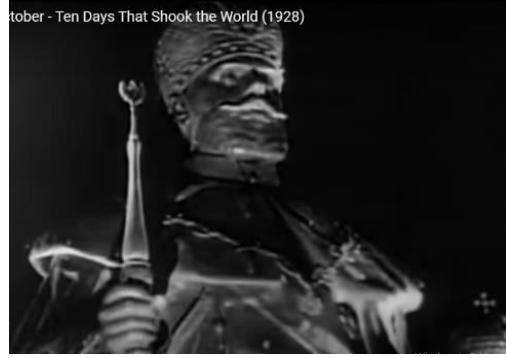
Şekil 3. October filminden sahne. Sergei Eisenstein,1927 Kaynak: https://www.youtube.com/watch?v=tQ9GCi4Gjso

October - Ten Days That Shook the World (1928)