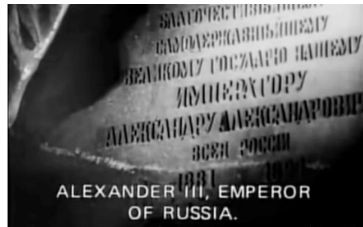
Şekil 7. October filminden sahne. Sergei Eisenstein,1927