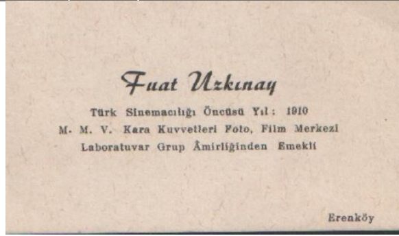
Şekil 9. Kartvizit, Fuat Uzkınay