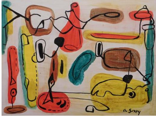
Şekil 5. Arshile Gorky, Soyut Kompozisyon