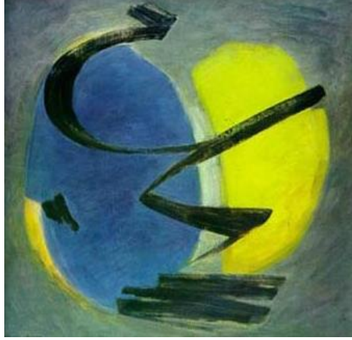
Şekil 7. Şemsi Arel, Yeşil Kompozisyon