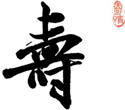
Şekil 10. "Uzun Ömür" anlamında Çin kaligrafisi yazı örneği, 2017