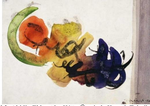
Şekil 3, Abidin Elderoğlu, Kâğıt Üzerinde Karışık Teknik, 1979