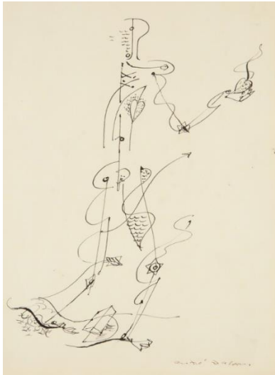
Şekil 4. André Masson, Dessin automatique, Kağıt üzerine mürekkep, 40,6 × 29,8 cm, 1925-1926 Kaynak: https://www.artsy.net/artwork/andre-masson-dessin-automatique 16.05.2021

Lataour, kültür kavramının tanımını yaparken, insanın doğayı bir kenara koymamızla yaratılmış bir artefaktır" der (Lataour, 2008). Şekil 4' teki artefakt (insan eliyle yapılmış eser, yapay, istenmeyen görüntü) ise, Andre Masson'un eserinde; doğallığı içsel bir uzlaşa ile yüzey üzerine bırakılmış özdevingen çizgisel kaligrafik eylemin sanatçı ve sanat icrasının arasındaki kopukluğu giderici bir pratiğidir.