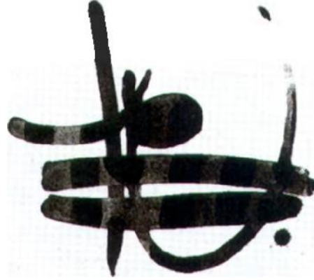
Şekil 1: Adnan Turani, Tuğrani Tuğra, 1976, Sulu Mürekkep, 50x60cm., Ankara, Özel Koleksiyon.

Turani, yazı ve hat konusunda Klee'nin sanatıyla karşılaştırırken, sanatçının kendisini kurtardığı aktif bir varlık alanı olarak bahseder. Dinamik bir ruhla, serbest ve gagesiz bir şekilde hareket etmek olduğunu vurgular. İllüzyonist bir taraf değil daha çok grafiksel yönünü gösteren imajlardır. Adnan Turani, çizgi kullanımını kaligrafinin, yani el yazısının heyecanı ve içgüdüsellığı ile sanatsal yaratıcılığın resimlerinde ortaya çıktığı öge olarak nitelemektedir.