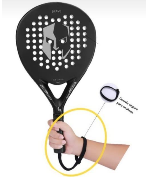
Resim 5. Padel kordonu ve kullanımı