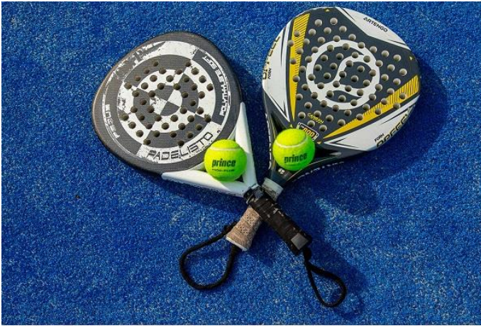
Resim 4. Yeni Padel

Teknolojiyle birlikte padelerde hızla gelişmiştir. Yüzey ölçüleri artırıldı ve kontrplak, alüminyum, kauçuk boya ve reçine gibi malzemeler kullanıldı ve artık yolun sonu gibi duran cam elyafına dönüştü. Ancak teknolojik gelişme devam etti. Oyuncular ve taraftarlar, karbondan ve daha hafif ama daha güçlü malzemelerden yapılmış padellerden memnun kaldılar (resim 4).