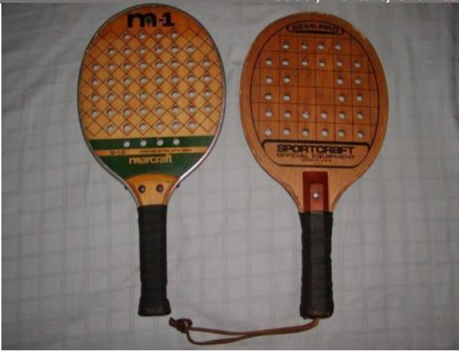
Resim 3. Eski Padel

Kaynakça: International Padel Federation, 2017.