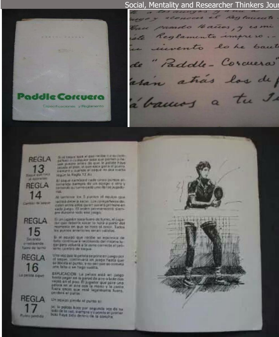
Resim 2. İlk oyun kuralları kitabı

Kaynakça: International Padel Federation, 2017.