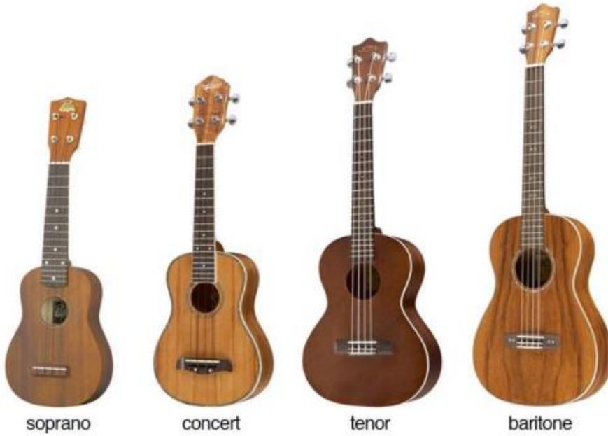
Şekil 1: Ukulele Çeşitleri