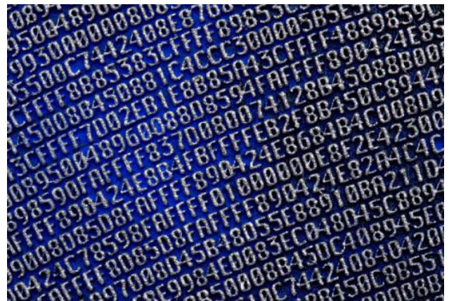
Görsel 5-6-7: Robert Alice; Aklın Portreleri