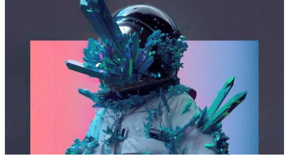
Görsel 2-3-4: Beeple Everyday: The First 5000 Days