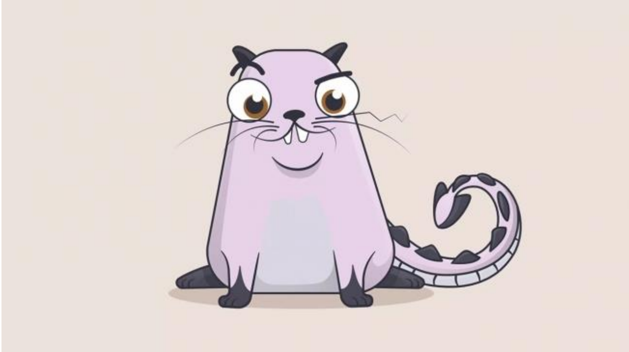
Görsel 1:

NFT - Non fungible token - yani değiştirilemez para olarak adlandırılmaktadır. Bir kripto para birimi olan Ethereum ile oynanan dijital ticaret oyunu Crypto Kitties’te blok zincirde saklanan ve hiçbiri birbirinin aynısı olmayan sanal kedileri alıp satarak ilk NFT’lerin temeli atılmıştır (Yakar, 2021).