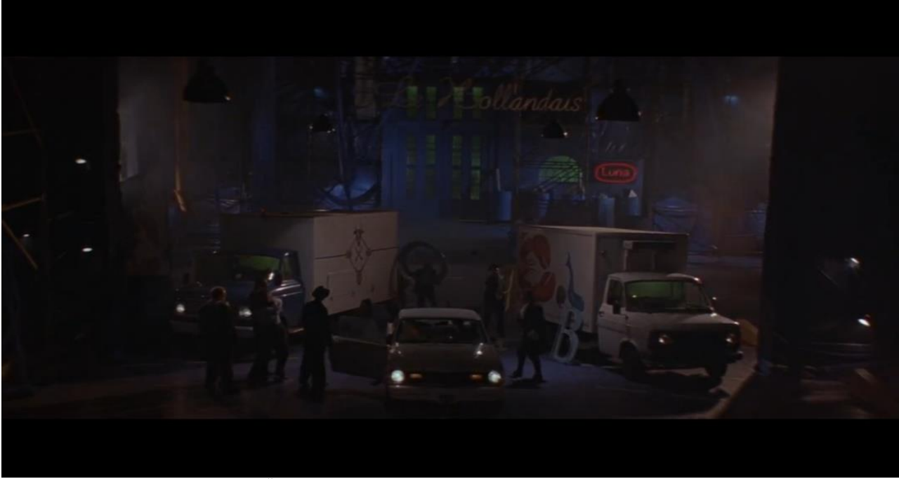
Resim 1: "Albert'in Restoranının Önü"

Filmin açılış sahnesi Albert'in restoranının önünde akşam vakidir. Mekâna karanlık ve koyu renkler hâkimdir. Bu sahnede Albert adamları ile bir adama şiddet uygulamaktadır. Dışarıda geçen bütün sahnelerde siyah renk hâkimdir. Burada gecenin renginden yararlanılarak kötülüğün hâkim olduğu bir atmosfer yaratılmıştır. Mekânın tamamen karanlık olması aynı zamanda Albert'in zalim ve zorba karakterinin de sembolüdür. Dışarıdaki karanlık aynı zamanda filmin gidişatının da habercisidir.