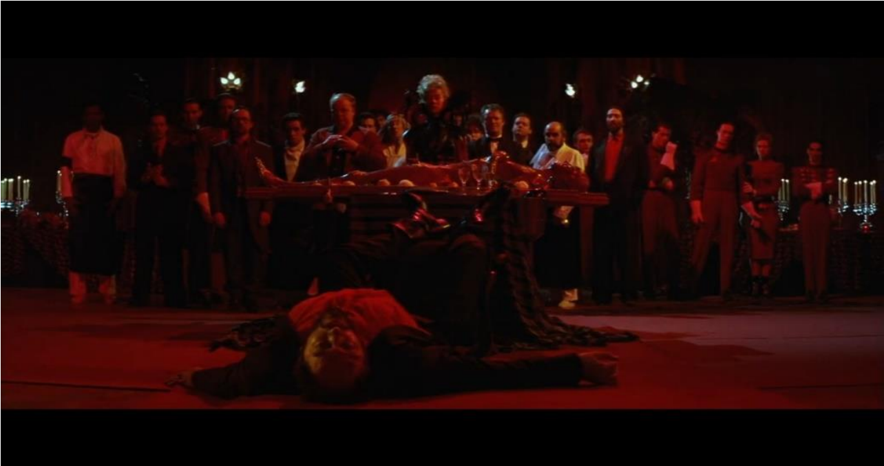
Resim 4: "Georgina'nın İntikamı"