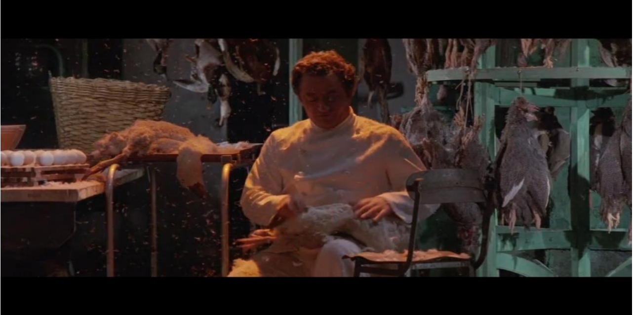
Resim 8: "Mutfakta Yemek Hazırlığı"