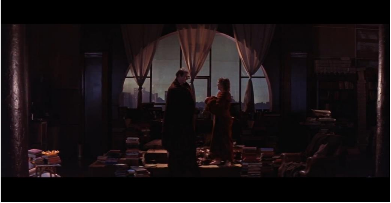
Resim 9: 'Michael'in Evi'