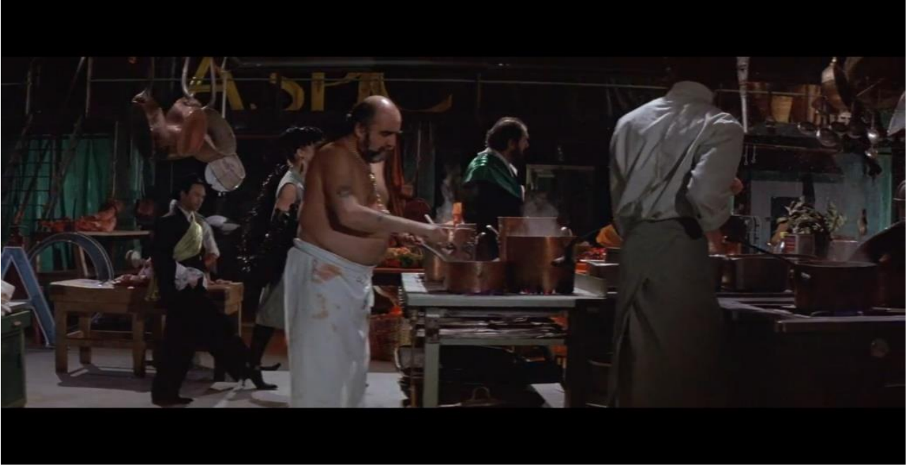
Resim 7: "Mutfakta Yemek Hazırlığı"

Mutfak aynı zamanda Georgina ve Michael'in Aşklarını yaşamak için buluştukları ikinci yerdir. Burada Richard'ın onları gizlemesiyle birlikte olurlar.