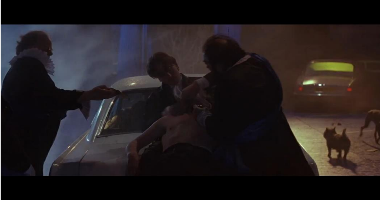
Resim 2: "Albert'in Restoranının Önü"