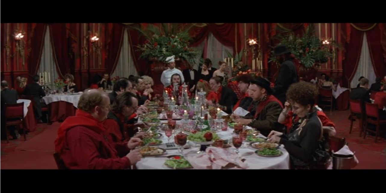
Resim 3: "Yemek Salonu"

mekândaki kırmızı renk Albert'in vahşiliği ve gücünü temsil etmektedir. Aynı zamanda Georgina ve Michael birbirlerini burada fark ederler. Film boyunca bu mekanda Albert'in gücünü vurgulayan kırmızı renk final sahnesinde anlamını değiştirerek Georgina'nın intikamını vurgulamaktadır. Tüm bunlar izleyicide bu mekânda herkesin bireysel olarak kendi tutkusunu yaşadığı yer izlenimi yaratmaktadır.