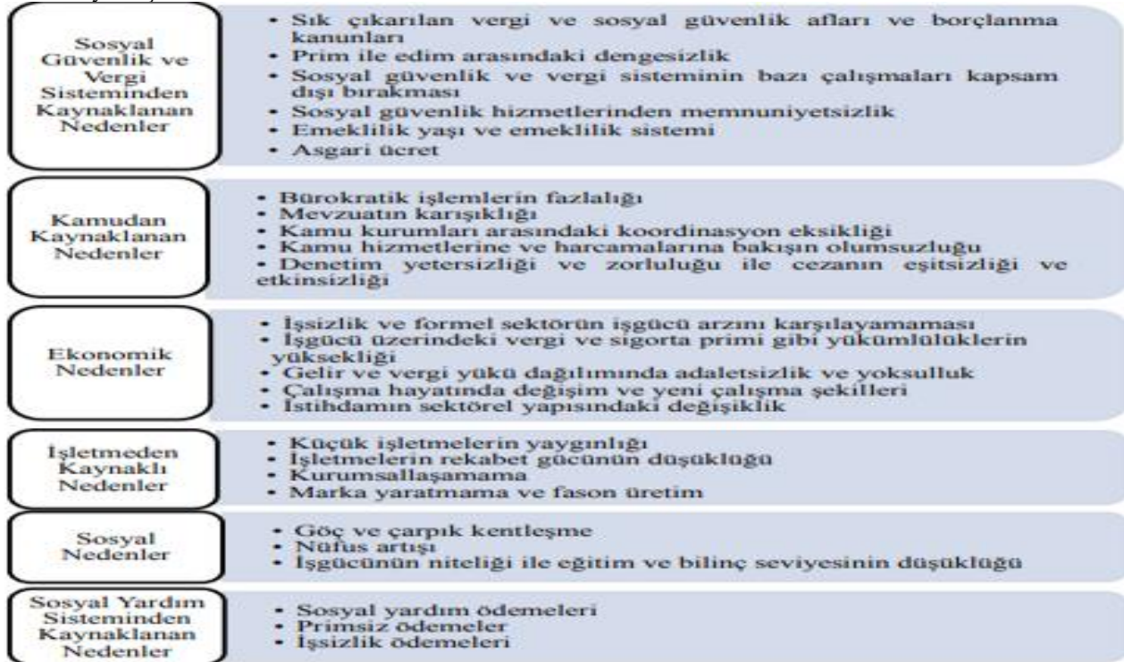
Şekil 1: Kayıt Dışı İstihdamın Nedenleri

Kaynak: Karaarslan, 2010: 53. Kutbay,2018,176