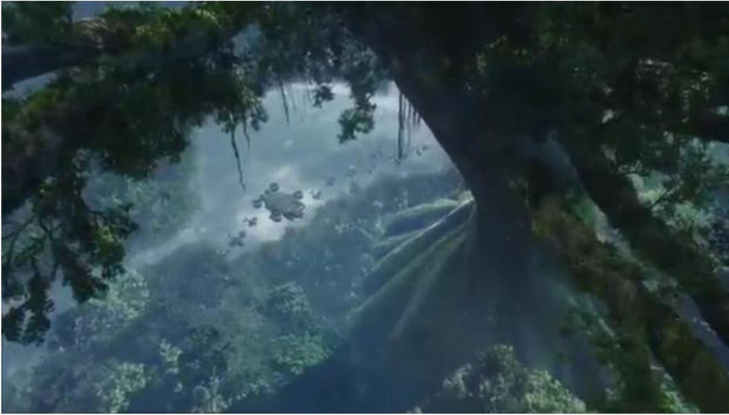
Görsel 12: Naavi Halkının içinde yaşadığı ağaç (Avatar, 2009)

İlk olarak ağaç filmde bize yaşayan bir gezegenin bütünlüğü olarak yansıtılıyor. Filmdeki ağaç gezegen ile bir bütün olup, sistemi ayakta tutması, diğer ağaçların köklerinde birbirine bağlılığı görülüyor. Tüm bunlar İskandinav mitolojisinin anlattığı ağaç köküne bağlı 9 dünya hikayesine benzer. Tüm bu benzerlikler tıpkı ağacın etrafında dolaşan ve Ragnarok (İskandinav dünyası kıyameti) da ortaya çıkacak olan Nidhogg adlı dev ejderha ile kuvvetini arttırmaktadır. İskandinav (Viking) mitlerinde evrenin hepsi Yggdrasil adlı dünya ağacının birbirine bağladığı dokuz dünyadan oluşurdu. Ağacın köklerini kemiren Nidhogg adında bir yılan yada ejdere sahiptir. (NTV Mitoloji s240) Ejderha birçok yerde yılan ile bütünleşmiş bir parçaya sahiptir. Ayrıca ejderha çeşitli hayvanların birleşimi olarak sayıldığına bile yılan onun ana iskeletini oluşturmakta ve fiziksel olarak görülen bir benzerliğe sahiptir. (Smith 2016 : 110) Generalin kullandığı aracın ejder olması da bu anlamdan bir benzerlik taşımaktadır.