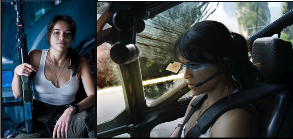
Görsel 3: a)Trudy adlı karakter (Avatar, 2009) b) Trudy'nin tarafını değiştirip Na'vi'lerin yanında aldığı mücadele sırasındaki makyajlı hali (Avatar, 2009)

Filmde Jake'in ilk Avatar tecrübesinden sonra Trudy karakteri ile tanışıyoruz. Trudy karakteri benzeri karakter olan ,Han solo için Campbell ve moyers tespiti olarak ikili arasındaki diyalog şu şekilde geçer.: