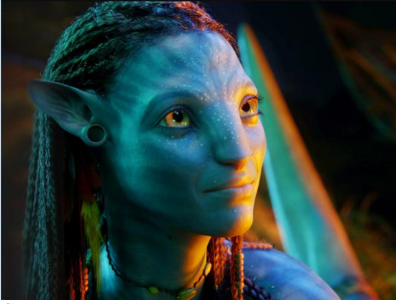
Görsel 5: Neytiri karakteri (Avatar, 2009)

Tüm bunların dışında Neytiri karakterini oynayan oyuncu Afrika kökenli bir karakterdir. Bu oyuncunun suratu ise Na'vi halinin temsilinde okunmaktadır. Karakter ilk baştan beri temsilinde bu şekilde yerliyi temsil etmektedir.