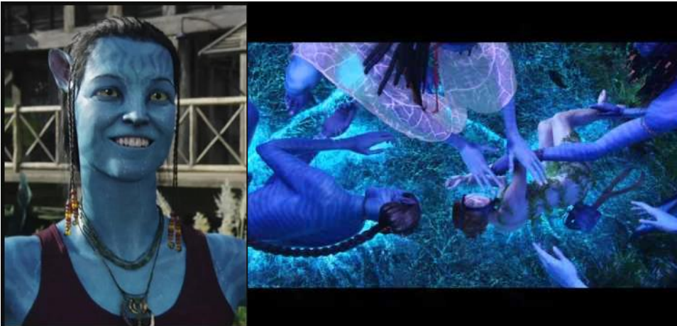
Görsel 6: a) Grace'in Avatari (Avatar, 2009) b) Grace'in kendi bedeni ve Avatari yan yana (Avatar, 2009)

Grace ayrıca doğa ile bütünleşmesini kendi sözleriyle de anlamak mümkün. Pandora gezegenini şirket sahiplerine tanımlama çalışırken onlara ‘ ‘ ağaçlar arası elektro-kimyasal bir iletişim var. Sinir sistemindeki sinapslar gibi her ağaç etrafındaki ağaçlarla bağlı. İnsan beynindeki sinir sisteminden çok daha fazla bağı sahip bir sisteme sahip gezegen. Gezegen yaşayan bir organizma gibi. ‘ ‘ diyor. Diğer filmdeki karakterlerin bakışı dışında yerlileri vahşi , gezegeni bir kaynak olarak görmekten uzak bir karakter.