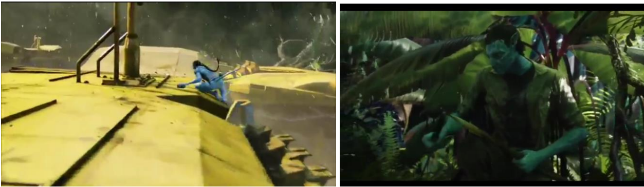
Görsel 9: a) Jake'in ormanı savunmak adına yıkıcı araç ile mücadelesi Jake'in kabul töreni sırasında bir görsel (Avatar, 2009) b) Jake'in ormanda ilk yalnız kaldığı gece (Avatar, 2009)

Tüm bu değişimlerden sonra Jake artık bir Na'vi'dir, ve kendini bu şekilde hissetmeye başlar. Tüm oalyların başında onlara ihanet etmek ve onları ortadan kaldırmak için gelen Jake onların zarar görmesini istemez. Kabul ve birleşmenin ardından ilk Bedene girişinde ve aslında artık Yerli olarak kimliğinde ilk uyanışında saldırı ile karşılaşır. Şirket ormana girmeye başlamıştır. Kendisi daha önce bulunduğu teknolojik araçlara bir yerli bedeninde müdahale eden kişidir. Bu müdahalenin sonunda durduramadığı araçların ardından topluluğa gidip her şeyi itiraf eder ve onları orayı terk etmeye ikna etmeye çalışır. Bu ikna çabaları sırasında fişi çekilen Jake şirket ve yerliler arasında bir taraf seçme konumuna düşmüştür. Jake artık başta onun bedenine yabancı ve doğduğu bedende nefes bile alamadığı gezegende mücadele eden tarafa geçmiştir. Son mücadelesinde yetersiz olacağını kabul eder ve en azından yerlileri oradan kurtarmak için itirazlarda bulunur. üstüne hem İnsanlar tarafından öteki kişi hemde Na'vi ler tarafından öteki kişi olur.