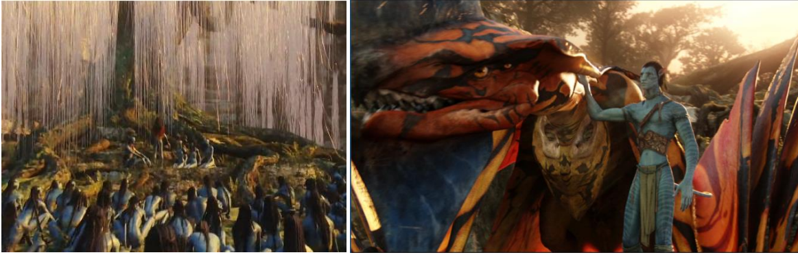
Görsel 14: a)Halkın ruhalar ağacına yardım çağrısı (Avatar, 2009) b) Toruc-Macto ve Jake (Avatar,2009)

Ayrıca sadece eski Türkler değil Afrika’da animizm denilen inanişya göre sadece insanların ve hayvanların ruhunun değil canlılar aleminin etkisinde olan birçok cinve iblisin barındığı var sayar. Bu inanişyadaki en önemli ruh toplulukları ise doğa ruhları olurken doğa ruhları Ağaçlarda, pınarlarda, nehirlerde ve dağlarda yaşar. (Ntv Mitoloj, 2016: 448) Jake karakteride Toruc-Macto olduktan ve halkı savaşa çağırdıktan sonra Eywa’dan(ruhalar ağacı) yardım ister. Tüm bu inanişylara benzer şekilde final savaşında vahşi hayvanları yardıma yollayanda Eywa’dır .