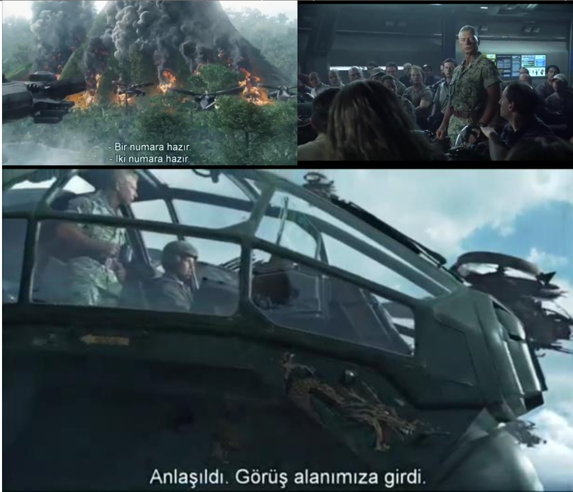
Görsel 4: a)General (Avatar, 2009) b)Ordunun ilk ağaca saldırısı (Avatar, 2009) c)General'in savaş gemisi 'DRAGON' (Avatar, 2009)

İskandinav Mitlerinde Odin her ne kadar baş tanrıda olsa savaş tanrısıydı . Odin şiddet ve savaşı temsil eden bir tanrıydı. Ayrıca asil olarak doğanları- kralları , savaşçıları , şairleri destekler; Thor ise , nüfusun çoğunluğunu oluşturan özgür çiftçileri desteklerdi. (Crossley-Holland, 2016: 33-34) Komutan filmin İskandinav mitolojisindeki bağları olan diğer bir temsilde Odin'dir. Ayrıca general yerlilere saldırdığı sırada onlar ateş açma emrini verdiği araçlardan birisi Odin'in emrinde savaşta ölmeye mahkum olan insanları seçip onları Valhalla adlı cennete getiren genç, güzel kadınların adıdır. (Crossley-Holland, 2016: 385)