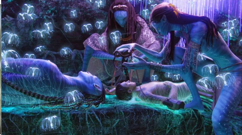
Görsel 11: a)Şaman , Neytiri'nin annesi (Avatar, 2009)b)Şaman'ın Jake'in bedenini değiştirmek için yaptığı büyü anı (Avatar, 2009)