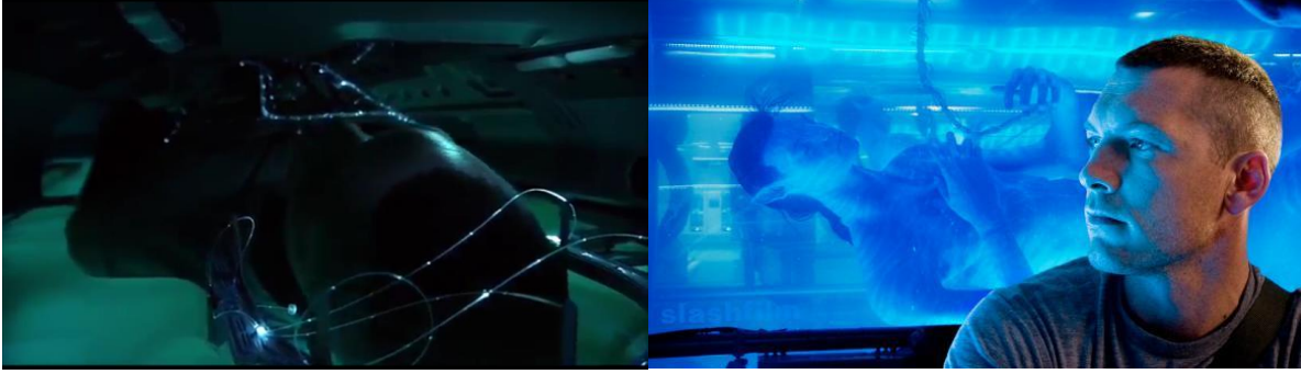
Görsel 7: a) Avatar teknolojiğine bağlanılma sistemi (Avatar, 2009) b) Jake ve Avatar 'ı, arka planda Avatar bedenlerinin tüp içinde gelişimi gözüküyor. (Avatar, 2009)

Filmin adını da aldığı teknolojik olarak beden değiştirme aracının adı Avatar , bedenın başka bir bedeni zihin transferini bir kabuk aracılığı ile yapılmasıdır. Kabuk ile bağlantı filmde Jake karakterinin yerlilerin dünyasındaki hayatıydı. Bir yandan aslında Jake'in yerli dünyası ile bağları uykudaydı. Bu uyku ile benzer bir mit olarak avusturalyalı aborjin yerlilerin "düş zamanı" diye inançları ile benzerlik taşır. uykuya ve hayal dünyasına daldıklarında girdikleri "düş zamanı" sonsuz ve "ezeldir". Sıradan yaşama zemin hazırlar ; düş zamanında ölüm akış, olayların ve mevsim döngüleri egemendir. Düşler aleminde güçlü arketip varlıklar olan atalar yaşar, yaşamak için gerekli olan avcılık , savaş , seks dokumacılık ve sepetçilik gibi becerileri öğretirler.(Armstrong, 2014: s 16) Tıpkı bu tanımlamadığı gibi Jake karakteride bu rüya anlarında Na'vi ırkı ile bağlanıp oradaki yaşamını kurmaya başlıyor. Neytiri ile geçirdiği süre boyunca ondan, avcılık gibi eğitimler alıyor. İleride Neytiri ile cinsel birlikteliğini yaşıyor.