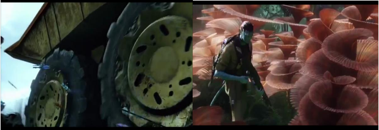
Görsel 1. a) Filmde Jake'in gezegene girildiğinde karşılaştığı kamyon. ( Avatar , 2009) b) Jake'in gezegenin doğasıyla ilk karşılaştığı sahnede orman içindeki bitkiler ( Avatar , 2009)

Filmde gezegeni ile ilgili detaylı bilgileri Jake'in Avatar 'ı ile ilk kez resmi göreve çıkışında tanışıyoruz. Bu zamana kadar film bize sadece askeri üsleri ve teknoloji ile bütünleşmiş mekanları yansıtırken Jake'in Avatar 'ı ile birleşiminden sonra gezegenin gerçek yüzünü görmeye başlıyoruz. İlk olarak Jake'in helikopterden ilk inişinde karşımıza çıkan orman aslında dünyaya benzer bir niteliktedir. Görülen doğa ve bitkiler gerçekte var olan bitkilerin büyümüş ve küçülmüş katlarından çıkarılmıştır. Biryandan görsel olarak gezegen hala dünyamızdan etkilere sahiptir.