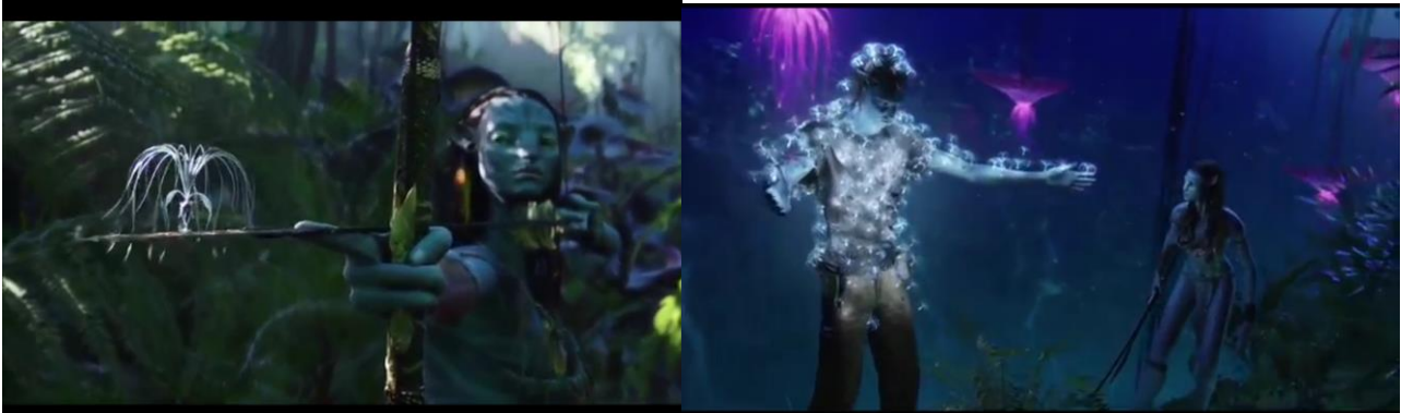
Görseal 10: a)Neytiri Jake'e hedef aldığı sırada okunun üstüne konan işaret. (Avatar, 2009) b)Neytiri'yi orman tarafından Jake'e karşı uyarıldığı an (Avatar, 2009)

Tıpkı Türk boylarında doğan lider gibi Jake'inde işareti ve kutsallığı bir ağaç yoluyla ve ağaç ile ilgili ışık yoluyla işaretlenmeye sahiptir. Daha sonrasında Jake ile ilgili verilen bu işaretlerin her biri tıpkı Mitolojilerdeki durumlarına benzer şekilde okumalara sahiptir. Neytiri aldığı işaretten sonra başlarda Jake'i öldürmek için okunu gererken Jake'in ilk gecesinde vahşi hayvanlar ile kavgasında onun zarar görmesine engel olmak adına hayvanları öldürür. Bunun üstüne Jake bu durumdan duyup Neytiri'ye teşekkür etmek istediğinde Neytiri'nin doğa ile ilişkisinin bağı olarak Neytiri bunu teşekkür olarak kabul etmez. Vahşi hayvanların ölümünü bir kayıp olarak görür. Bu inancın temeli .Afıraka da genelde sadece insanların değil doğadaki her şeyin ruhu olduğuna inanılırdı(NTV MİTOLOJİ: 2016 :436). Neytiri Jake'i cahil bir bebek olarak sınıflandırır. Ona 'gök insanı' diye hitap edip gök insanların cahil ve aptal olduğunu söylüyor. Eğitilmelerinin imkansızlığından bahsediyor. Jake bunun üstüne kendi yaşamını ona öğretmesi için yalvarınca bunu kabul etmeyip Jake'i başından atmak istediğinde tekrardan bir işaret gelir. Bu sefer işaret çok daha kesin ve çok daha parlak bir ışığa sahip olarak karşısına çıkınca artık Neytiri kutsal olan bu ışığı rededemez ve Jake i köye götürmeye karar verir. (görsel 3 b)