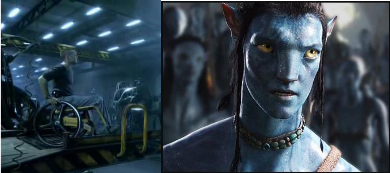
Görsel 2: a) Ana karakter Jake'in kendi bedenindeki formu (Avatar, 2009) b) Jake'in Avatar formu (Avatar, 2009)

İnkalarda kutsal olan her şeye Huaca adı verilirdi . Huacalar doğüstü güç taşıdığına inanılan insanlar , hayvanlar , bitkiler ya da nesnelere birer huaca sayılırdı. Bu sıfatı çoğunlukla aykırı görünümlü olağan dışı durumlarda alırlardı. Bozuk kaya oluşumu birden çok yumurtlayan meyve sebzeler, albino insanlar gibi ( Ntv Mitoloji, 2010: 416 ) Jake'in bu fiziksel engeli benzer bir aykırılık durumu okunabilir . Bunun dışında Jake kabile kabulünde eğitim öncesinde, kabiledaki Şaman lider tarafından deliliği olan bir kişi olarak gözüktür. Jake'in Avatar 'a ilk bağlanışın da kutsal ve özel olma sinyalinin alması. Jake Avatar 'la ilk tanışmasında ona ne kadar tecrübe ve simülasyon tecrübesi olduğunu sorulduğunda hiç olmadığını söylüyor. Herkes onun bocalamasını ve asla beceremeyeceğini düşünürken kendisi bağlandığı anda Avatar 'ı kontrol edebiliyor ve koşarak ortamdaki çıkabiliyor. Ayrıca odadan kaçtığı sırada teknolojiden kopuşunu görüyoruz ; yeni Bedenin fiziksel hislerinin ortaya çıktığı ilk iletişimi çıplak ayakları ile kuma teması oluyor. Kumu hissederken Jake'e yansıyan huzur ise filmde 'doğa ' temasının temsil ettiği tarafı gösteriyor.