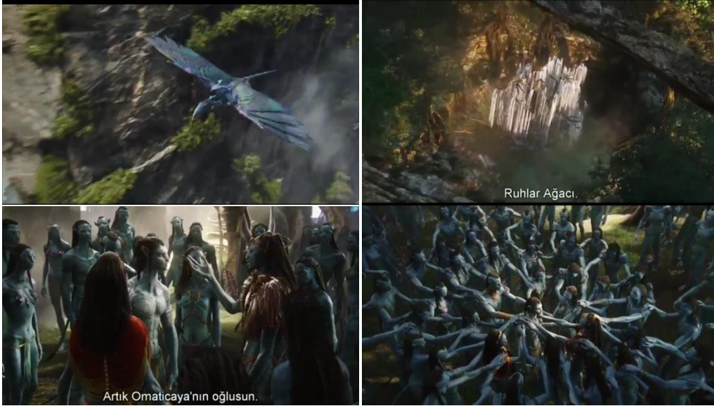
Görsel 8: a) Jake ve İkran'ı (Avatar, 2009) b) Jake'in İkran ile gezdiği sırada Ruhlar ağacını ilk görüşü (Avatar, 2009) c) Jake'in kabul töreni sırasında bir görsel (Avatar, 2009) d) Jake'in kabul töreni sırasında bir görsel (Avatar, 2009)

kutsallığı hakkında filmin ilerleyen yerlerinde çok daha fazla önemi olduğu gösterilecektir. Bölüm 3.6 Doğa inancı başlığında bu konuyla ilgili detaylara bakılacaktır.