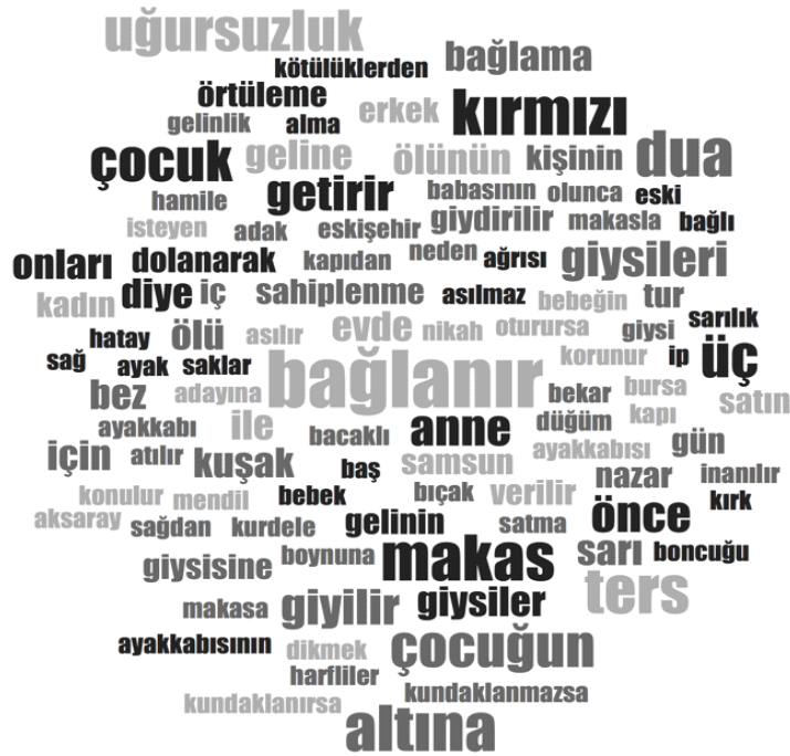
Şekil 1. Bulgular sonucu ortaya çıkan kelime bulutu

Ayakkabıları ve giysileri sağdan giymek kara iyelere karşı koruyucu nitelik kazandırmaktadır. İnsan vücudunun başlangıcı baş olarak kabul edildiğinde; eteklerin ayaktan giyilmesi ters giyilmesi olarak kabul edilmekte ve kara iyelerin terslikle geleceğine inanılmaktadır. Bu nedenle Ankara bölgesinde etek uğursuzluk getirmemesi amacı ile baştan başlayarak giyilmektedir. Aynı şekilde ayakların kibleye doğru uzatılarak çorap giyilmesi ve giysilerin ters giyilmesi ile yine tersliğin geleceğine inanılmaktadır. Fakat Bursa'da nazar değmemesi için bir terslik katmak amacı ile iç çamaşırının ters giyilmesi uygulaması bulunmaktadır.