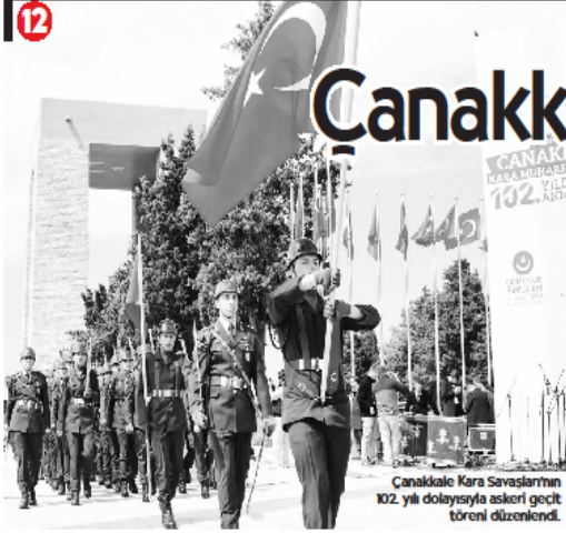
Çanakkale Kara Savaşları'nın 102. yılı dolayısıyla askerî geçit töreni düzenlendi.