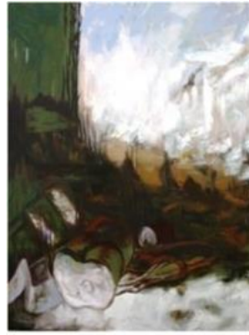
Görsel 4. Yüzleşme II, 130x100 cm, TÜYB, 2017, Malatya

Katılımcının bu sözlerinden, çevresel sorunlara karşı, toplumsal farkındalığın artmasına sebep olması amacıyla da araştırmada yer alan resimleri ürettiği yorumu yapılabilir. Nitekim katılımcının sözlerinden toplumsal farkındalık ve duyarlılığın oluşmasında sanat eğitiminin rolünün büyük olduğunu anlatmaya çalışması, kendi yaptığı resimlerin de bu amaç doğrultusunda ortaya çıktığını destekler niteliktedir. Nitekim kendi çevresi içinde yaşayan sanatçı, insan zihninin en derin tabakalarında yer alan, kendine özgü içgüdüsel yaşamı eşsiz yeteneğin ona verdiği güçle maddeye dökülebilen kişidir (Ersoy, 2002). Thomson ise bu konuda şöyle demiştir; Sanatçı, bilincinde iç dünyasına ilişkin bir çelişkiyi ortaya çıkararak onu bir sanat yapıtı içinde çözer (Thomson, 1987). Dolayısıyla bu duyarlılıkların kazandırılmasını ve yaratıcı çözümleri içeren sanat eğitiminin gerekliliğinin çevre ve gelecek için oldukça önem arz ettiği söylenebilir.