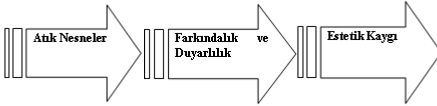
Şekil 2. Temaların Bulgulara Göre Dağılımı

Bu araştırmada bulgular; araştırma sürecinde yarı yapılandırılmış görüşme, katılımcının çalışmaları, gözlem ve veri toplama yöntemleriyle elde edilen verilerin tematik analiz yöntemiyle temalara ayrılması neticesinde ortaya çıkmıştır. Temalar belirlenerek başlıklar haline getirilmiştir. Atık nesnelere, farkındalık ve duyarlılık, estetik kaygı olmak üzere toplam 3 başlık belirlenmiştir.