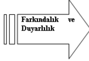
Şekil 4. Farkındalık ve Duyarlılık

Bu tema; atık nesnelerin çevreye ve insanlığa verdiği zararın, farkındalık ve duyarlılık ile dile getirilmeye çalışılması neticesinde oluşan resimsel yorumlamaları içermektedir.