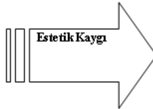
Şekil 5. Estetik Kaygı

Bu tema; araştırmada yer alan çalışmaların yapım aşamasına dair oluşan estetik kaygıyı içermektedir.