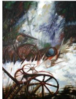
Görsel 3. Zıtlıkların Armonisi, 130x100 cm, TüYB, 2013, Malatya