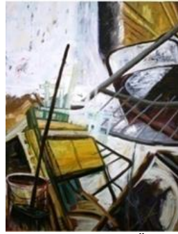
Görsel 2. Yığıntı, 130x100 cm, TüYB, 2012, Malatya