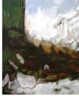
Görsel 1. Yüzleşme II, 130x100 cm, TüYB, 2017, Malatya

Böyle nasıl desem aslında özel bir sınırlandırmam yok atıklar konusunda her türünü konu edebilirim diye düşünüyorum. Tabi rastladıkça biraz da öfkelendikçe anlatabiliyor muyum?(1.Görüşme).” sözleriyle güçlendiren katılımcının, atık nesnelere karşı duyduğu rahatsızlıktan ve söz konusu olan bu rahatsızlığı sanat aracılığı ile dile getirdiğinden söz edilebilir. Özellikle katılımcının “...Tabi rastladıkça biraz da öfkelendikçe anlatabiliyor muyum?” ifadesinden, atık nesnelere sebep olduğu çevre kirliliğine karşı olan hassasiyetinin artmasının, resim çalışmalarında da oldukça hissedilir olduğu yorumuna gidilebilir.