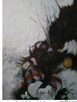
Görsel 5. Yüzleşme I, 130x100 cm, TÜYB, 2012, Malatya

çirkinliğin izlerini bulabiliyorsunuz mesela ama zihnimde cümleye dökemeyeceğim ve benim tarafımdan bilinen bir olgunlaşmış estetik görüntüler var (2. Görüşme).