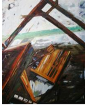
Görsel 6. Çerçeve, 130x100 cm, TÜYB130x100 cm, TÜYB2014, Malatya