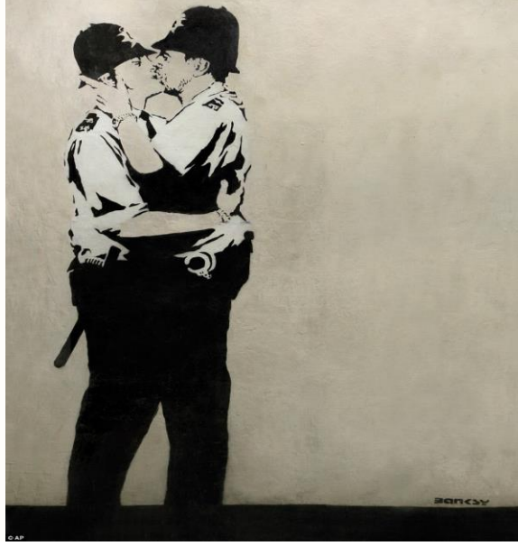
Görsel 10. Banksy, Bütün Aşklar Geçerlidir

Bir New York Şeridi kulübünün dışında boyanmış olan bu kötü durum, toplumun seks tutkusu hakkındaki çirkin gerçeklerin vurgulanmasında etkileyici role sahiptir.