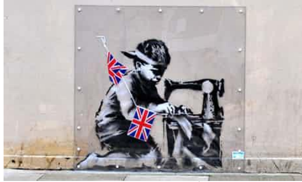
Görsel 18. Banksy, Köle İşçi, 2011

Küresel olarak insanlığın tükendiği; savaşların, zulümlerin, isyanların ortasında kalan masum halk ve çocuklar için pozitif bir algı yaratmak için yapılmış olan bu çalışmada, yarınlara umutla bakabilmeyi hatırlatmaktadır. Bu mesaj açıkça Londra parçasının yanındaki duvarda yapılmıştır.