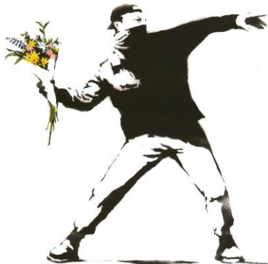
Görsel 16. Banksy, İyilik Kullanım

Savaşların, etnik çatışmaların, askeri darbelerin, politik iktidarsızlık ve büyük insan hakları ihlallerinin bir yan ürünü olarak ortaya çıkan göç ve beraberinde yarattığı mülteci krizi, her yıl katlanarak artmaktadır. Mevcut sorunlara çözümler bulunmadığı takdirde de artmaya devam edecektir (Loescher, 1993).