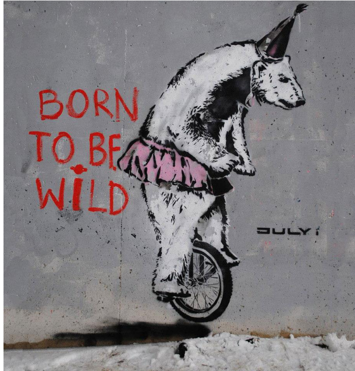
Görsel 21. Banksy, Vahşi Olmak İçin Doğdu

Banksy, 2009'daki Birleşmiş Milletler İklim Değişim Konferansı'nı, 4 tane duvarı küresel ısınma temasıyla boyayarak sonlandırmıştır. "Küresel Isınmaya İnanmıyorum" sloganıyla yaptığı bu çalışması ise en önemlisidir diyebiliriz.