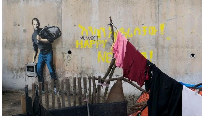
Görsel 15. Banksy, Jungle

Karşılaştığı engellemeler Banksy'in sanatının yönünü değiştirememiştir. Aksine, savunduğu değerleri daha da güçlü hale getirmiştir. Mülteci krizini vurgulamak için Steve Jobs resmini kullandığı bu çalışması (Resim. 15) bunun en net örneklerinden biridir.