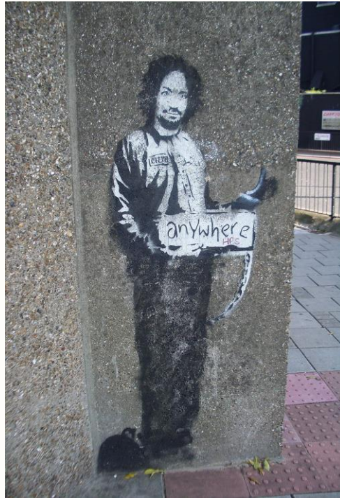
Görsel 6. Banksy, Ahlaki Sınırları Belirle

Banksy, sosyal ve politik sorunları çarpıcı bir dille sergileyerek insanları düşünmeye sevk etmenin yansıması hayat dersi niteliğindeki çalışmalarıyla da insanların düşüncelerinin şekillenmesinde aktif bir rol sergilemektedir.