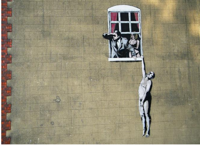
Görsel 8. Banksy, Herkesin İskeletleri Vardır

Burada, elinde fast food tepsi taşıyan bir mağara adamı tarafından, hızlı yiyecek tüketimi ve doğal olmayan beslenme şekline ince bir gönderme bulunmaktadır. Hazır yiyecek sunumunda bulunan bu mağara adamı tarafından bir uyarılma mesajı verilmektedir.