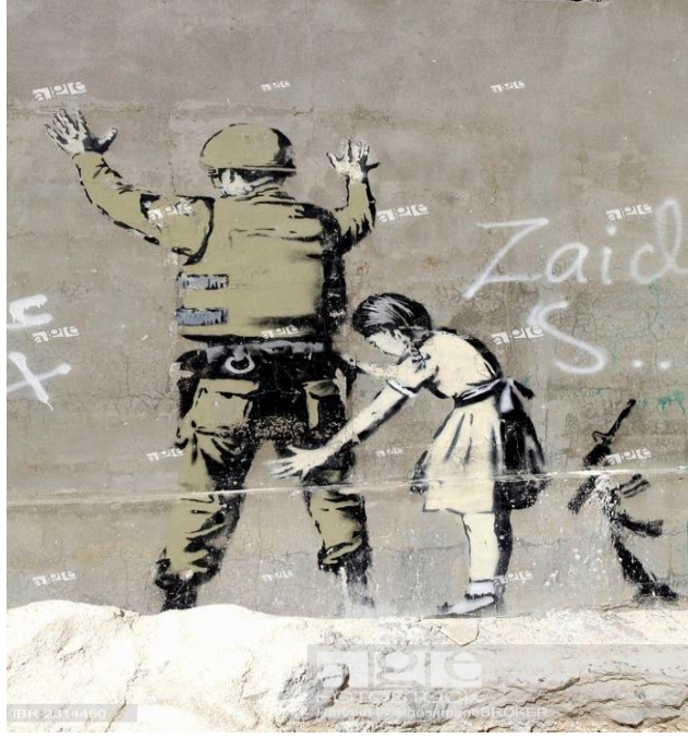
Görsel 1. Banksy, Batı Şeria Muhafızı, 2007

Bu eser, İsrail duvarının Beytüllahim bölgesinde resmedilmiştir. Banksy, Santa' Ghetto sergisinin tanıtımında bu resmi kullanmıştır. Sergi için Beytüllahim bölgesini seçmiş olmasının nedenini, buranın İsa'nın doğum yeri olması ve aynı zamanda tüm insan hakları ihlalleri iddialarının da merkezi olması şeklinde açıklamıştır.