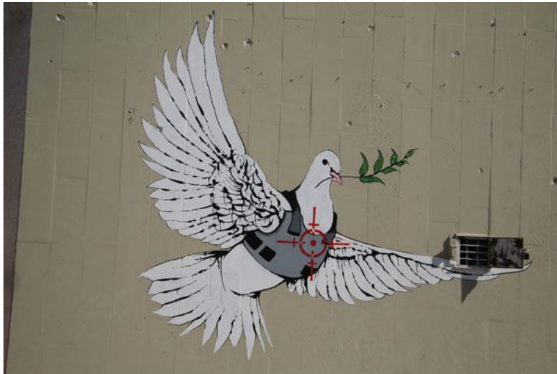
Görsel 2. Banksy, Barış Zırhlı Güvercin, 2007

Birbiriyle ilişkili üç teorik çerçeveye dayanan bu çalışmada, kurumsal ırkçılık, yerleşimci sömürgecilik ve güvenlik gerekçeleri belirtilmektedir. Çalışma, İsrail'in adalet ve yasa uygulama sistemlerinin Filistinli çocuklara nasıl davranıldığını ele alan, işgal edilmiş Doğu Kudüs'teki çocuk tutuklamalarını incelemektedir (Kovner ve Shalhoub-Kevorkian, 2017).