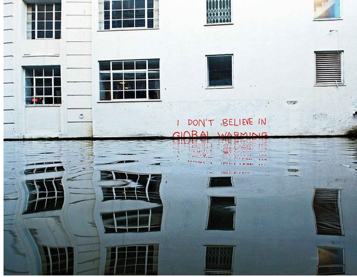
Görsel 20. Küresel Isınmaya İnanmıyorum

Banksy yalnızca politik ve kişisel-sosyal olayları konu edinmemiştir. Günümüz sorunlarından belki de en fazla göz ardı edilen "Küresel Isınma" sorununa dikkatleri çeken birçok çalışmaya imza atmıştır. Dünyanın iyi durumda olmadığını ve yaygın bir kitleyi uyarma amaçlı çalışmalar da yapmıştır. Bu çalışmalarından bazıları şunlardır: