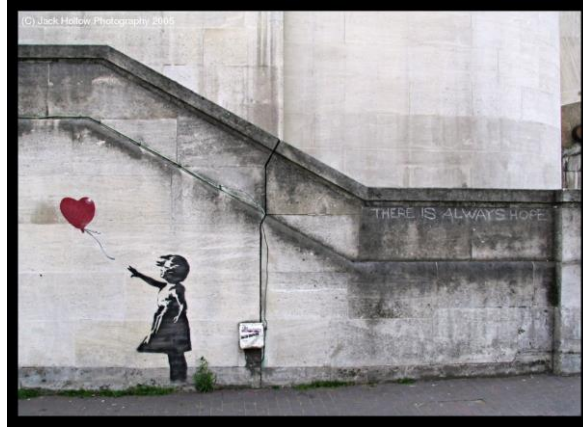
Görsel 17. Banksy, Her Zaman Umut Vardır

Londra’da yapılmış olan bu çalışmada, Banksy’in yine en çarpıcı işlerinden birini görmekteyiz. Burada bir protestocu, bir el bombası ya da başka bir zararlı maddeyle değil, masum bir buket çiçekle savaşıyor. Sanatçı burada, nazikçe müzakere ederek daha çok şey yapabileceğimizi önermektedir aslında.