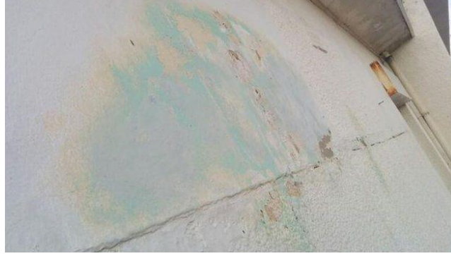
Görsel 14. Banksy'e ait Anti-Göçmen Kuşlar adlı çalışmasının kaldırdığı duvar

Yöneticilerin siyasi politikasına uygun görülmeyen sanatçının bu çalışması, kent konseyi tarafından yüzbinlerce liraya satılmıştır.