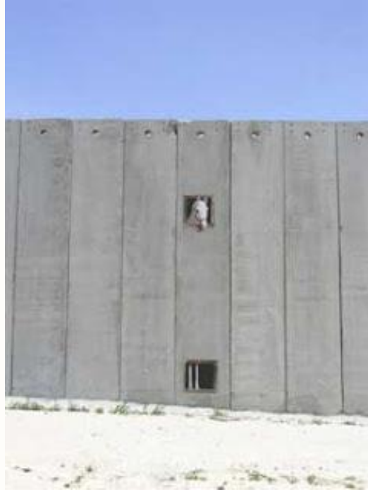
Görsel 5. Banksy, Kararlı Koşullar

Savaş elbetteki sadece insanları etkilemez. Aynı zamanda doğadaki diğer canlılar da bu olumsuzluklardan nasibini alır. Tıpkı İsrail Batı Şeria Duvarı tarafından özgürlüğü kısıtlanmış bu at gibi. Duvarın öteki tarafında sıkışıp kalmış bu atın görüntüsü bunlardan sadece biri.