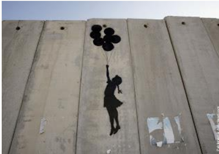
Görsel 4. Banksy, Balon Tartışması

Her şeye rağmen bir umut vaat eden bu resimde iki erkek çocuğu ve bir kumsal ile tamamlanmış bir plaj alanı gibi görünen palmiye ağaçlı manzara, gelecekte güzel günlerin geleceğine dair umudunu temsil etmektedir (Banskyworld, 2012).