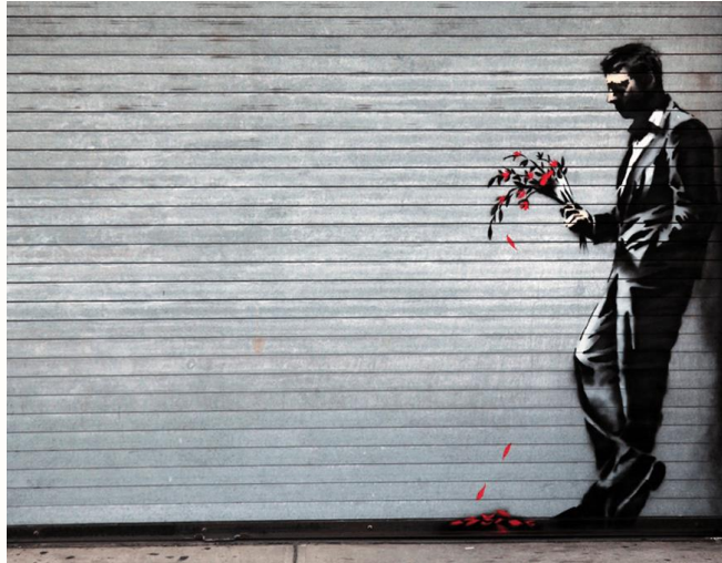
Görsel 9. Banksy, Aşk Şehvet Değildir

Bristol, İngiltere'de yapılmış olan bu çalışma, Banksy'in en ünlü çalışmalarından biridir. Oldukça mizahi olan bu sahnede, hepimizin saklayacak bazı şeyleri olduğu fikriyle birlikte, her şeyi ve herkesin görüldüğü gibi olmadığı da vurgulanmaktadır. Her şeye körü körüne inanılmaması gerektiği konusunda da bir uyarı niteliği taşır.