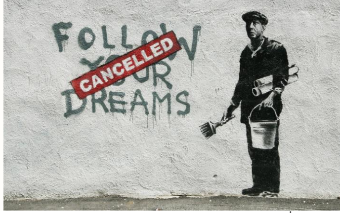
Görsel 12. Banksy, Başkalarının Hayallerinizi Yıkmasına İzin Vermeyin

Sokağın direniş ruhunu çalışmalarında dile getiren sanatçının bu çalışması, yine sadece bir farkındalık yaratmamakta, aynı zamanda duyguları harekete geçirici cesaret de sergilemektedir. Banksy'in en ünlü çalışmalarından biri olan bu Boston parçası ile hayal kırıklığına uğratılmış idealizm adına bir adım daha atmıştır. Birçoğumuz hayallerimizden vazgeçmek zorunda kalıyor, mali yükler ya da diğer zorluklar nedeniyle onları takip etmek zorunda hissetmiyoruz. Bu çalışma, uykuda olan bizler için bir uyandırma servisi işlevi görebilir. Sonuçta, dış dünyanın yarattığı hayal kırıklıklarına bakılmaksızın hayallerimizi takip etmeliyiz.