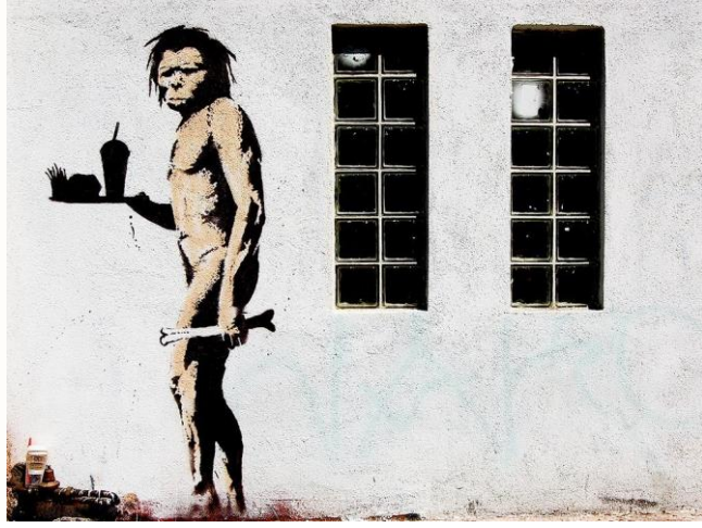
Görsel 7. Banksy, Geldiğin Yeri Hatırla

Burada, elinde fast food tepsi taşıyan bir mağara adamı tarafından, hızlı yiyecek tüketimi ve doğal olmayan beslenme şekline ince bir gönderme bulunmaktadır. Hazır yiyecek sunumunda bulunan bu mağara adamı tarafından bir uyarılma mesajı verilmektedir.