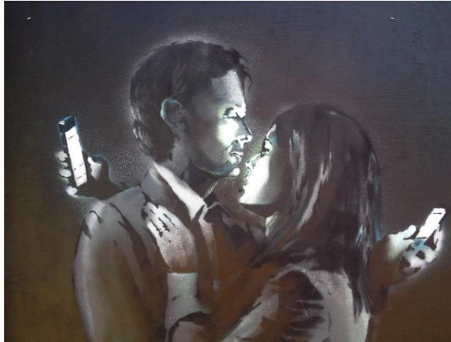
Görsel 11. Banksy, Anı Yaşa / Mobil Lovers

Banksy burada, geleneksel kurallara karşı çıkarak, uygun olanı kimsenin bilemeyeceğini ve buna müdahale edemeyeceğini ifade etmektedir. Sevgi sevgidir onun için.