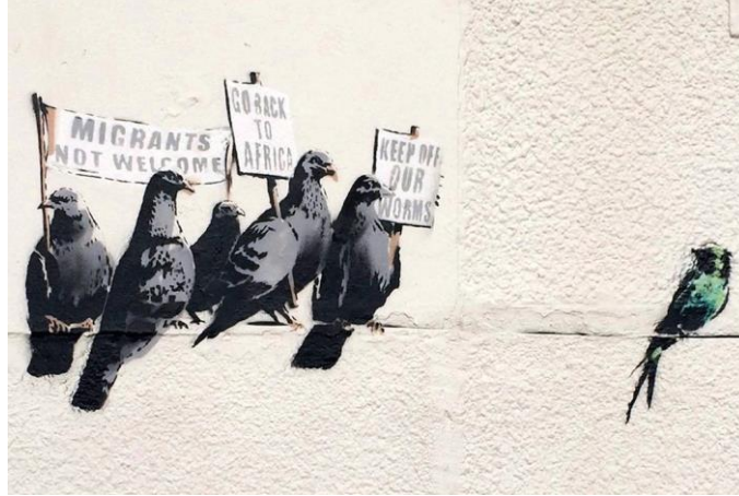
Görsel 13. Banksy, Anti-Göçmen Kuşlar

Uluslararası sorunlar üzerinde duran sanatçının dünya liderlerine göndermelerde bulunduğu önemli bazı çalışmalarından örnekler: