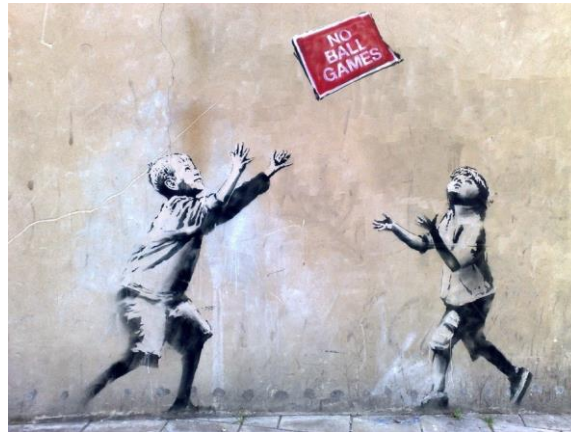
Görsel 19. Banksy, Topsuz Oyun

Çalışma daha sonra Amerika’da ortaya çıkarak, 500.000 Amerikan dolarına satışa çıkarılmış ve sonunda 1 milyon dolar karşılığında satılmıştır.