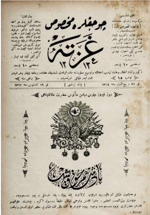
Görsel 2. Çocuklara Mahsus Gazete Dergisi, Onbeşinci Sayı, s. 1

Çocuklara Mahsus Gazete Dergisi yalnızca Osmanlı değil Cumhuriyet dönemi de dahil olmak üzere eski harflerle yayınlanan çocuk dergilerinin içinde en uzun ömürlü olanıdır. 1896'da çıkmaya başlayan dergi, yayınına 1908'e kadar sürdürmüştür. Gazete'nin ilk sayısı 9 Mayıs 1312/21 Mayıs 1896 tarihlidir. Derginin 19 Ağustos 1312 tarihli birinci senesinde yayınlanan on beşinci sayısının birinci sayfasında (kapak sayfası) çok özel bir tasarımı vardır (Şekil 2) . Sayfada şekil 2'de Osmanlı padişahının tuğrası büyük boyutta sayfanın ortasına ve logonun altına koyulmuştur. Tuğranın dört tarafında cümle yazılmıştır. Tuğranın yukarısına (Ruzi firuzi cülus-i miyamen manusi hazreti hilafetpenahi ) yazılmıştır. Tuğranın sağ ve sol tarafına (Padişahım devletinle şevketinle pek yaşa) cümleleri yazılmıştır. Tuğranın altına Celi Divanı hattı ile Padişahım çok yaşa yazılmıştır (Şekil 3). Birinci sayfada metinde bugünün çok önemli bir gün olduğunu, padişah-ı alemin tahta oturduğunu, Sultan Abdül Hamid han-ı saninin tahta cülus ettiğini, mübarek ve nimet ve refahın padişahın sayesinde fazla olduğunu, padişaha selam, medih vs. yazılmıştır. Derginin birinci senede yayınlanan sayısının logosunda "Çocuklara Mahsus" kelimeleri Rika hattı ile daha küçük ve yukarıda, "Gazete" kelimesi Sülüs hattı ile daha büyük boyutta o iki kelimenin altında yazılmıştır. Logo sayfanın ortasına yukarıya yerleştirilmiştir.