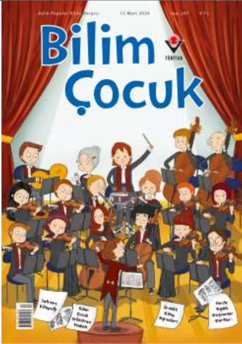
Görsel 7. Bilim Çocuk Dergisi. Mart 2020. Sayı 267. ( https://bilimcocuk.tubitak.gov.tr/ , 22.05.2019)