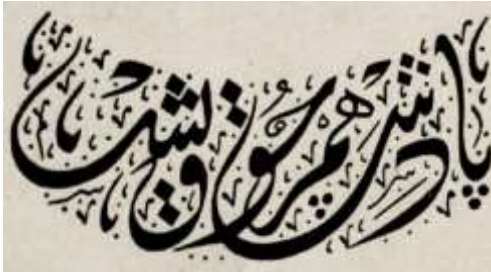
Görsel 3. Çocuklara Mahsus Gazete Dergisi, Onbeşinci Sayı, s. 1.

Genel bir değerlendirme yapacak olursak; Osmanlı Devletinin geleneksel Müslüman Türk toplumunun ahlâkî, sosyal ve bireysel değerlerini bu dergiler üzerinden çocuklara aktardığı söylenebilir. Çocuklar için hazırlanan dergilerin kapak tasarımları yetişkinler için hazırlanan dergilerin kapak tasarımlarına benzemektedir.