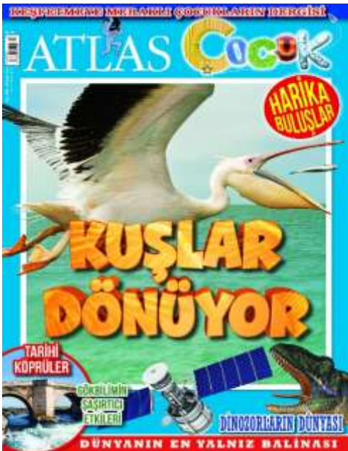
Görsel 5. Atlas Çocuk-Mart 2016. ( https://cicicee.com/dergi/atlas-cocuk-_20.04.2019 )

Atlas Çocuk Dergisi; Mart 2016 sayısında çocuklar, “Kuşlar Dönüyor”, “Tarihi Köprüler”, “Gök Biliminin Şaşırtıcı Etkileri” ve “Dinozorların Dünyası” dosyaları ile eğlenirken öğreniyorlar. Üstelik ” Harika Buluşmalar” da Atlas Çocuk, Mart 2016 sayısında yazılmıştır (Şekil 5).