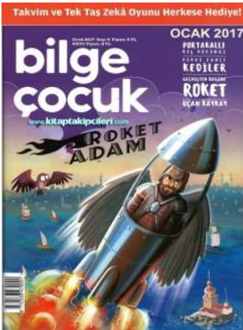
Görsel 6. Bilge Çocuk Eğitim Dergisi Ocak 2017 5. Sayı.

Bilge Çocuk Eğitim Dergisi (Ocak 2017 5. Sayısı (Şekil 6)): Derginin logosu net gözükmemekte olup çocuklara uygun bir font ile yazılmıştır. Kapak sayfasında kullanılan illüstrasyon çocukların dikkatini çekmekte olup çevresi boğulmamıştır ve başarılı bir kapak sayfa tasarımıdır. Yazılar sağ üst köşeye bloke olmuştur ve sayfanın düzenli tasarımında herhangi bir kargaşa yoktur. Türkiye’de son zamanlarda üretilen dergiler içerisinde Bilge Çocuk Eğitim Dergisinin kapak tasarımı bir çok açıdan çok başarılı bulunmuştur.