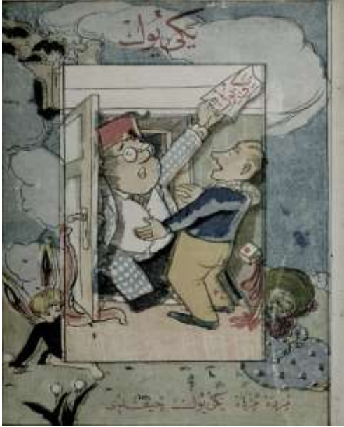
Görsel 4. Yeni Yol dergisi, Kırk birinci sayı, Kapak sayfası.

Derginin kırk birinci sayısının kapağı çok farklı tasarlanmıştır, tüm sayfa renkli yayınlanmıştır ve bir kaç renk vardır. Bu basın teknolojisinin gelişmesini göstermektedir. Logo matbuatta kullanılan Nesih hattıyla yazılmıştır, künye bilgileri yoktur, tüm sayfayı renkli illüstrasyon kaplamıştır (Şekil 4). Bu illüstrasyonda kapıdan giren çocuğun elinde Yeni Yol dergisi vardır ve kırmızı fesi ile Türk tarzında tasarlanmıştır ama illüstrasyonda Batı etkisi de görülmektedir. Bu kapak tasarımı sayfasında çocukların daha özgür olmaları, insanın figürü bulunması, canlı, hareketli ve renkler çocukların daha eğlenceli, mutlu ve özgür olmalarını imge etmektedir (Ghojoghi, 2019: 207).