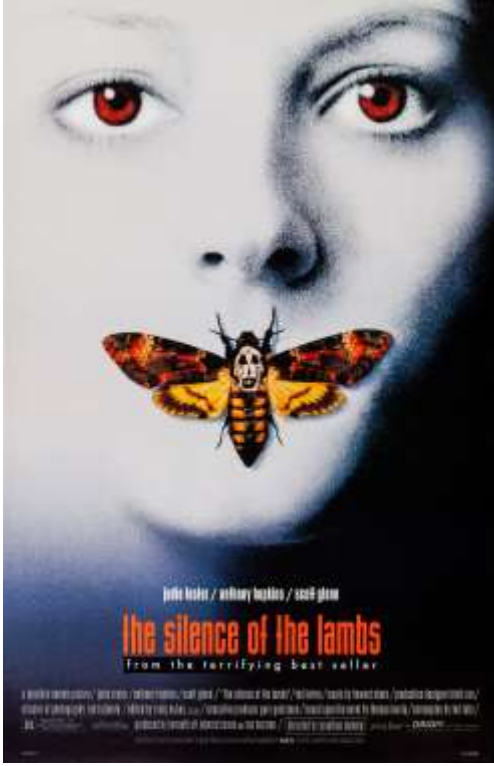
Şekil 1. Kuzuların Sessizliği